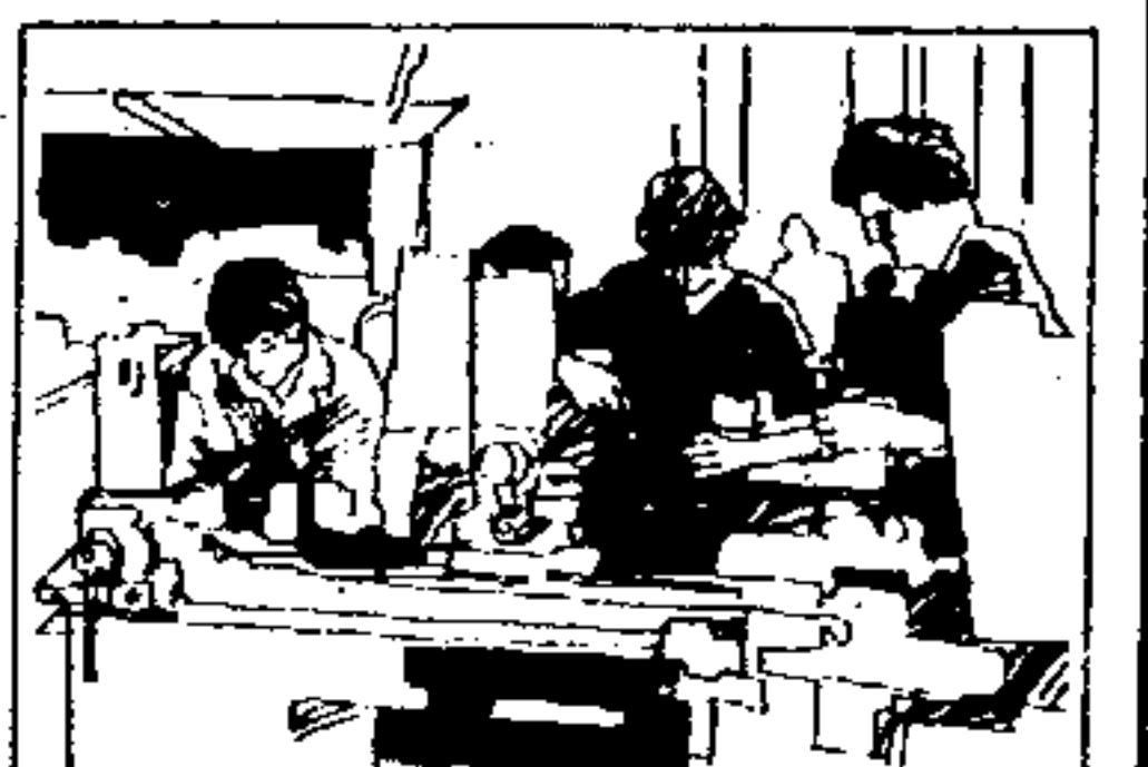
SNFMO Sistema Nacional de Formação de Mão-de-Obra.

“ Mas é sobretudo no campo social, acima de tudo nos investimentos feitos no homem e para seu bem-estar, que verdadeiramente realizaremos a independência nacional. Por assim julgar, desejo deixar bem claro que o pensamento e a ação do meu governo não se realizam só nas construções, nas obras e nos edifícios, nas fábricas e nas máquinas, nas usinas e nos geradores.