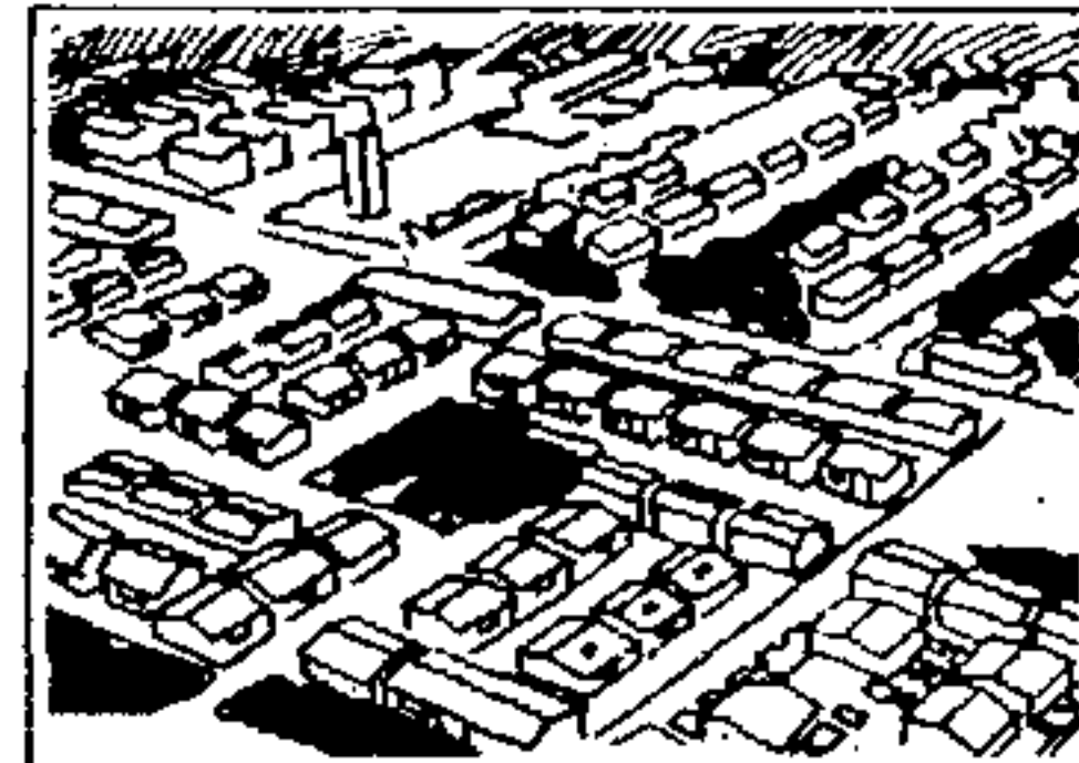
PROSINDI Programa de Habitação para o Trabalhador Sindicalizado.