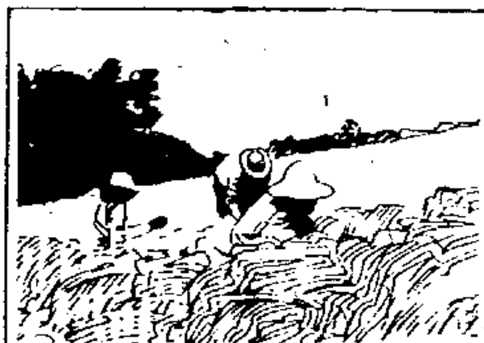
SENAR Serviço Nacional de Formação Profissional Rural