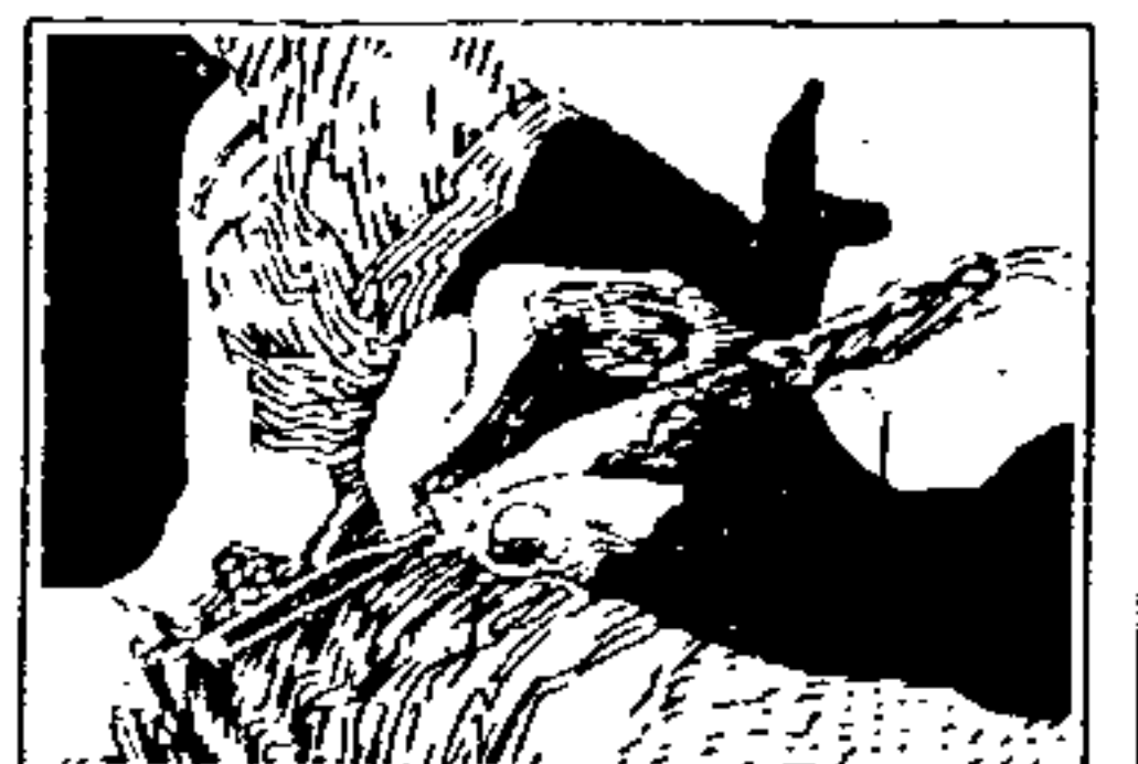
PNDA Programa Nacional de Desenvolvimento do Artesanato.