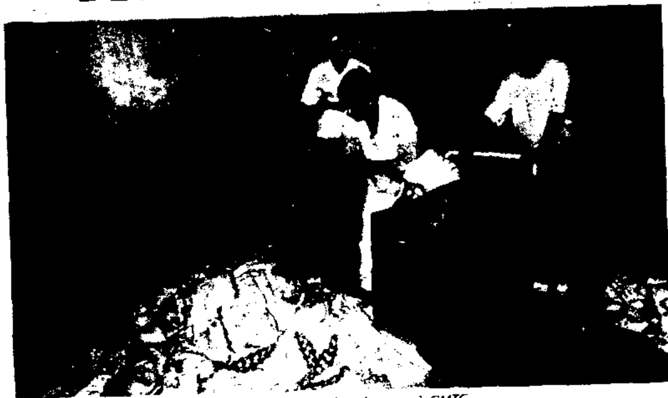
Montes de moedas chegam à CMTC, em carro-forte, para fornecimento de troco à população.