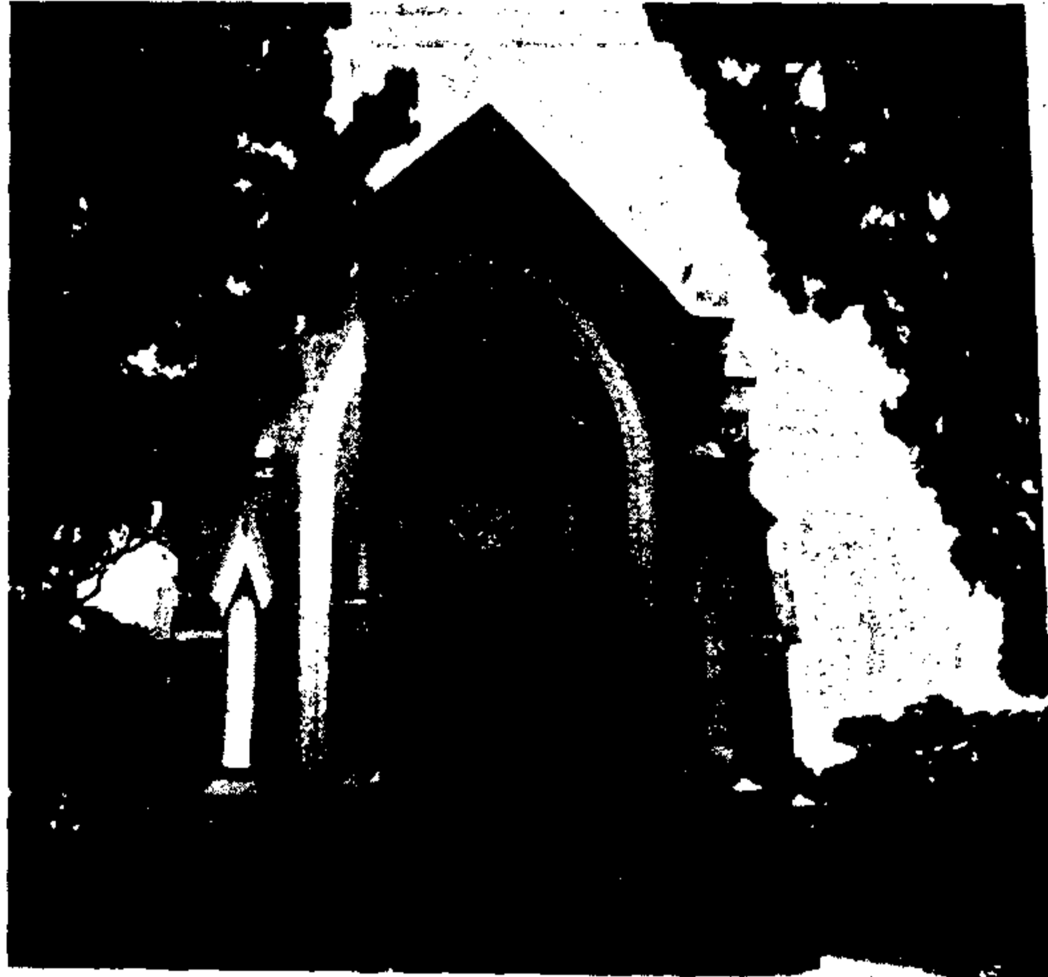
Cemitério da Consolação, um dos mais antigos da Cidade, terá controle de estacionamento na área.