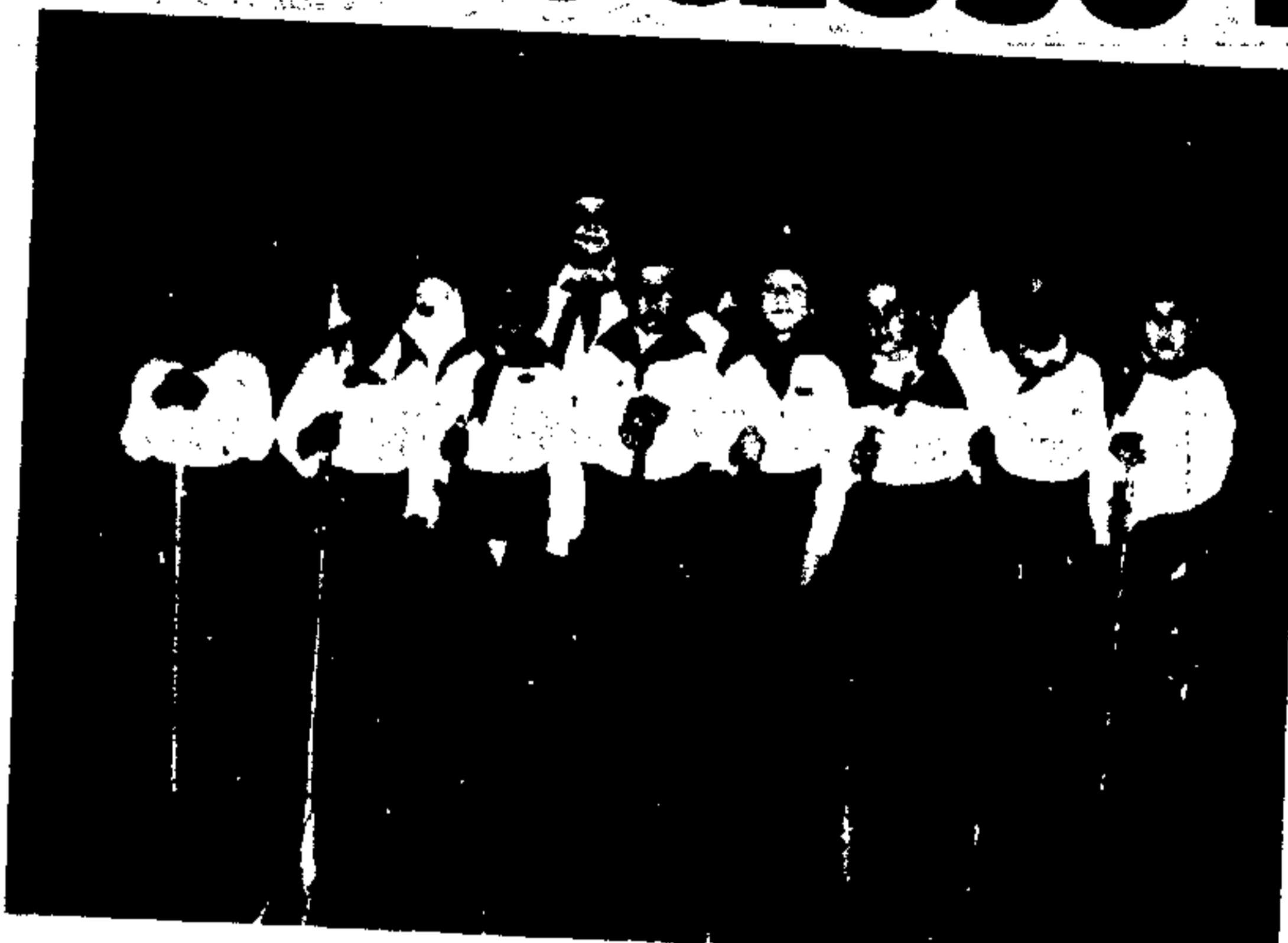
Os "gauchinhas" da EMEI Oswaldo Cruz

Uma das mais vivas preocupações da Secretaria Municipal de Educação, na atual Administração do Prefeito Jânio Quadros, foi a de criar uma infraestrutura operacional capaz de atender à demanda na área da educação infantil.