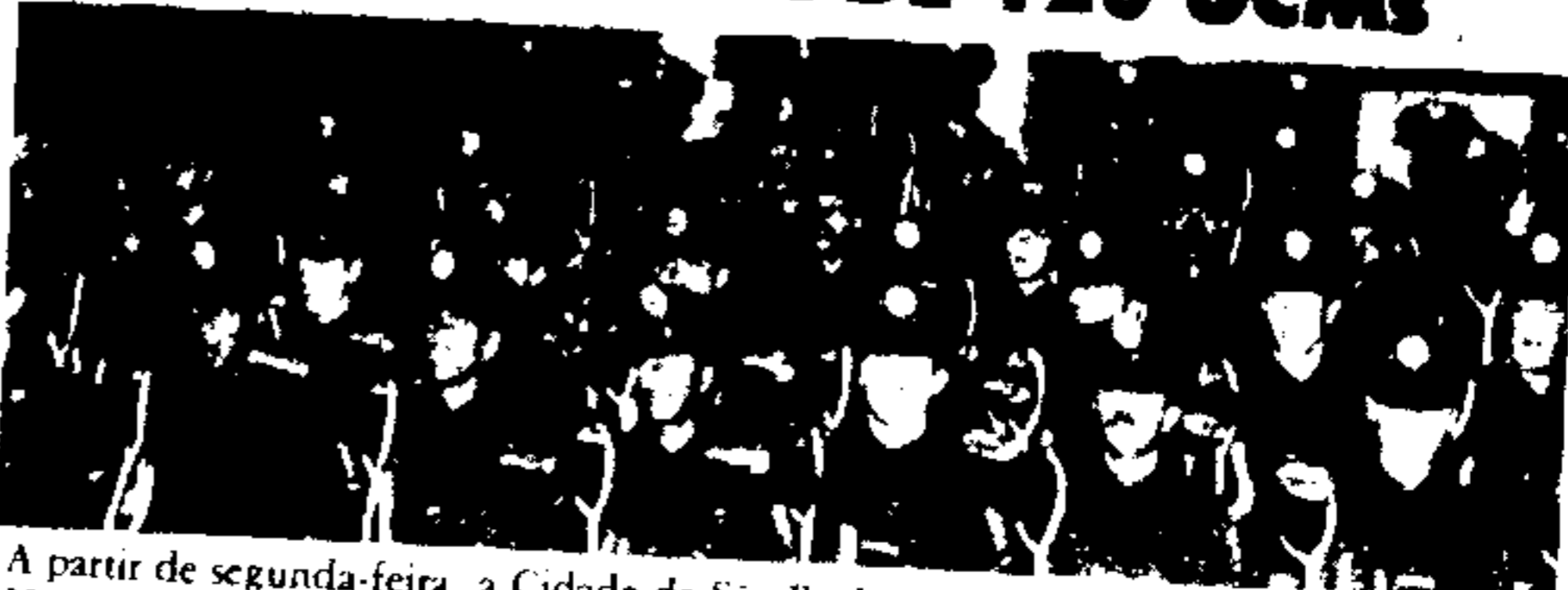
A partir de segunda-feira, a Cidade de São Paulo contará com mais 120 Guardas-Civis Metropolitanos, quando estará sendo formada a turma "Almirante Tamandaré", numa homenagem à Marinha de Guerra do Brasil. Na mesma ocasião, 44 GCM's receberão divisas e insígnias de Classe Distinta, Classe Especial e Subinspetor, e serão apresentados os cães amestrados pertencentes à Secretaria Municipal de Defesa Social. Páginas 2 e 3