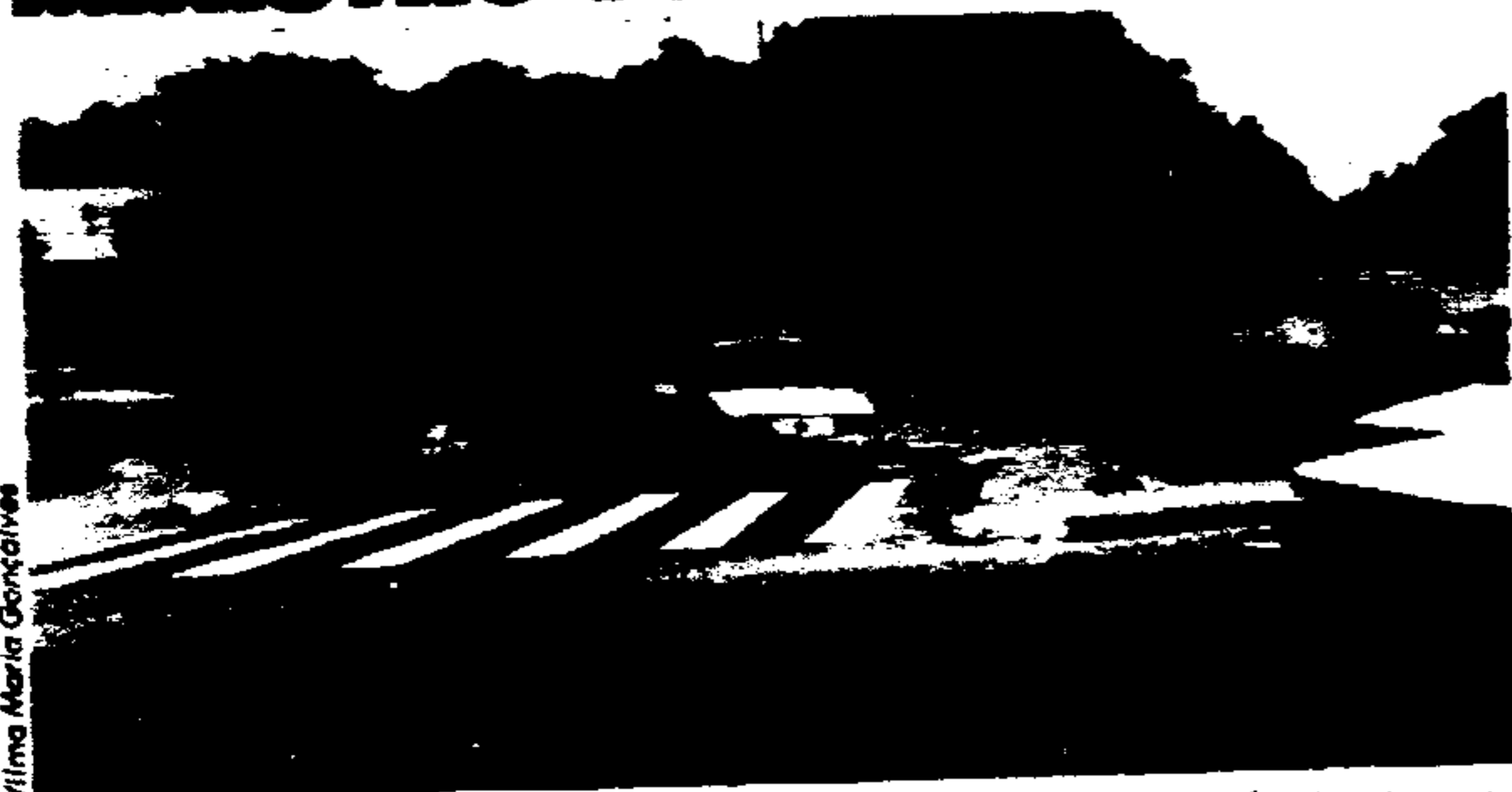
Carros nas calçadas ou sobre as faixas de segurança dos pedestres: duas infrações rigorosamente combatidas pelo Prefeito Jânio Quadros, numa campanha que começa a ter respaldo a nível federal.

O Ministro Paulo Brossard, da Justiça, encaminhou mensagem ao Prefeito Jânio Quadros dando conta da reestruturação que está promovendo no CONTRAN, visando "maior agilização das suas ações de normatização, definição das diretrizes e coordenação da nova Política Nacional de Trânsito, voltada principalmente para a segurança no trânsito".