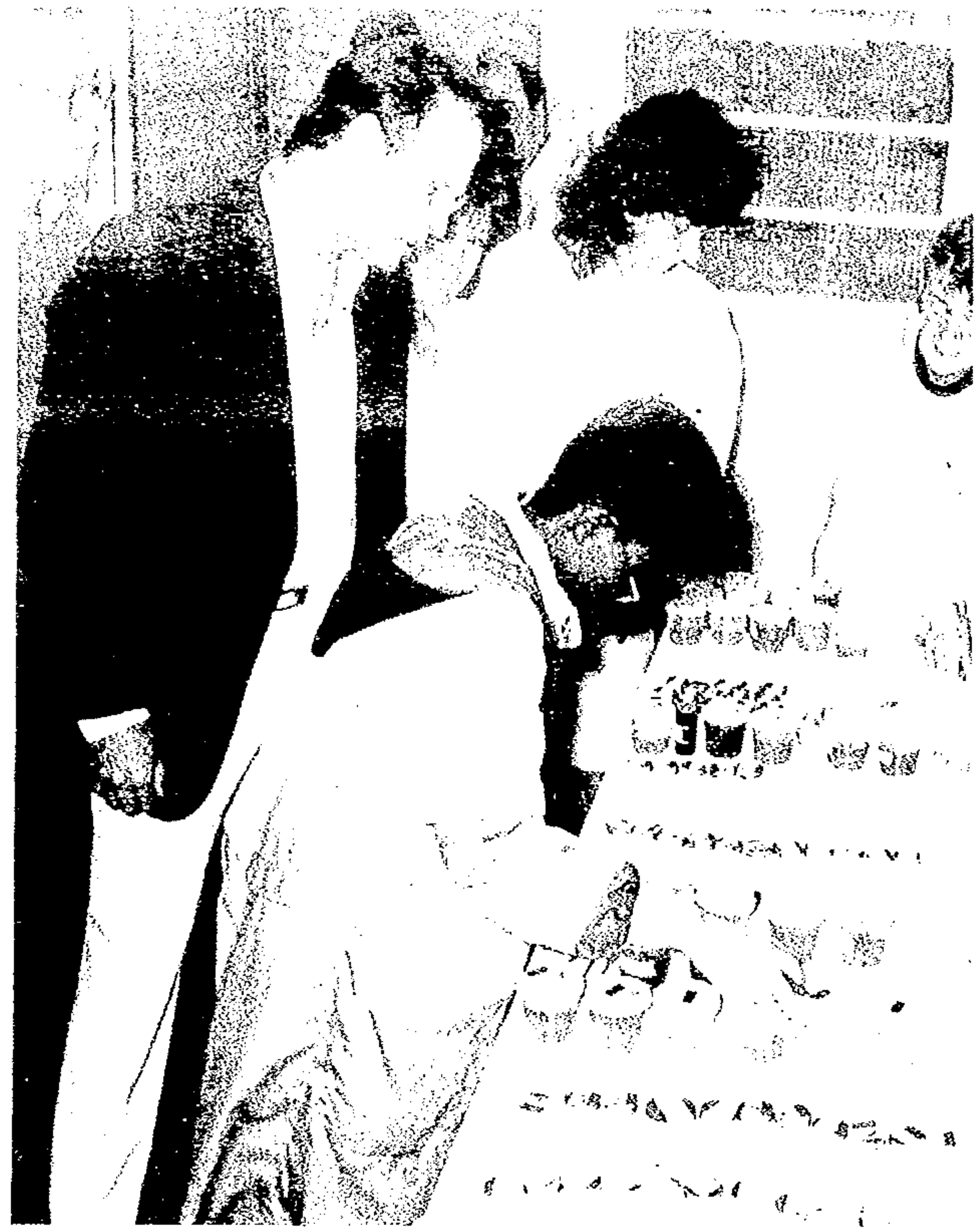
Jardim da Saúde