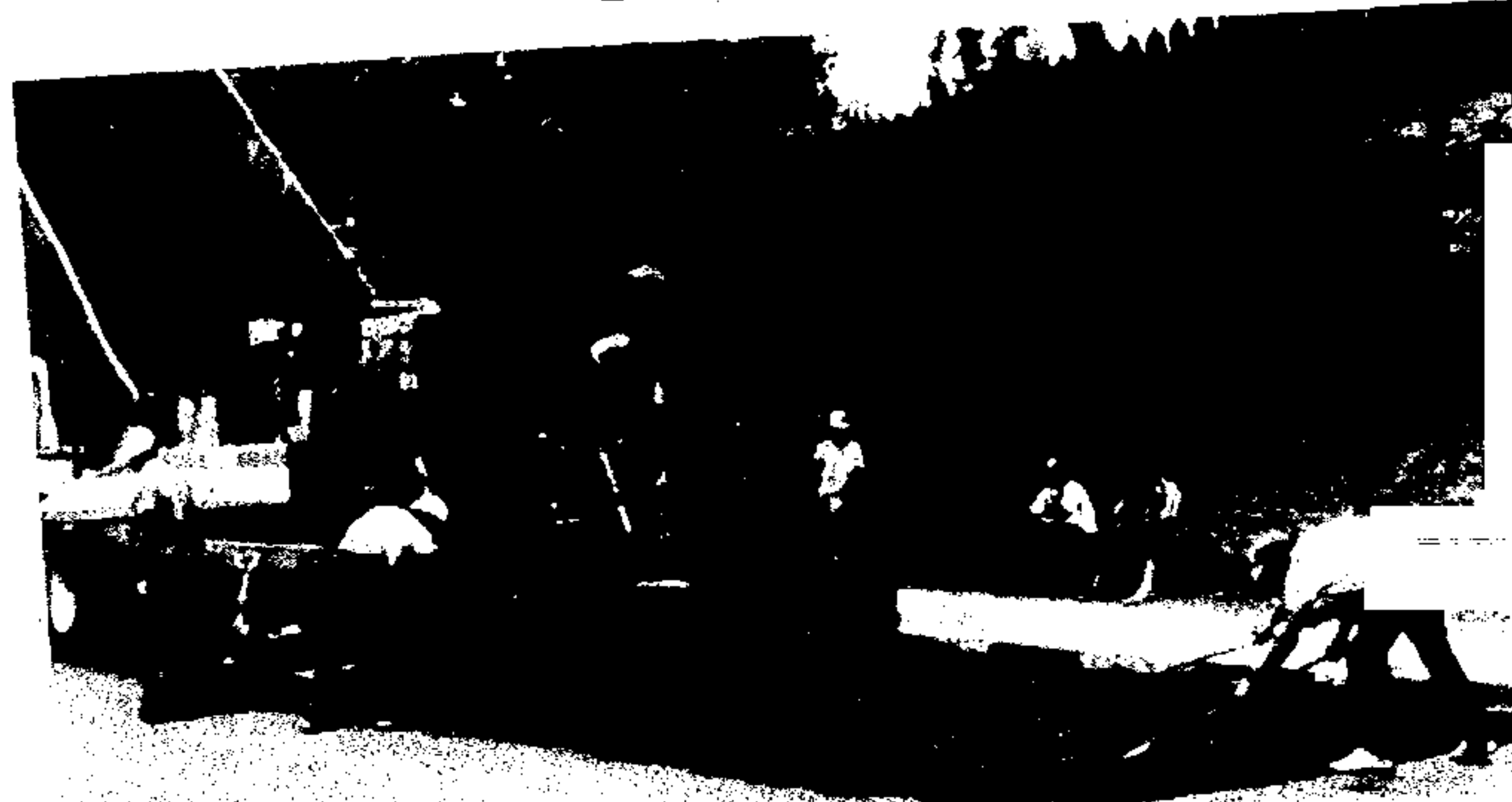
A pavimentação e a recuperação de vias públicas têm sido objeto de constante atenção da Administração Municipal.