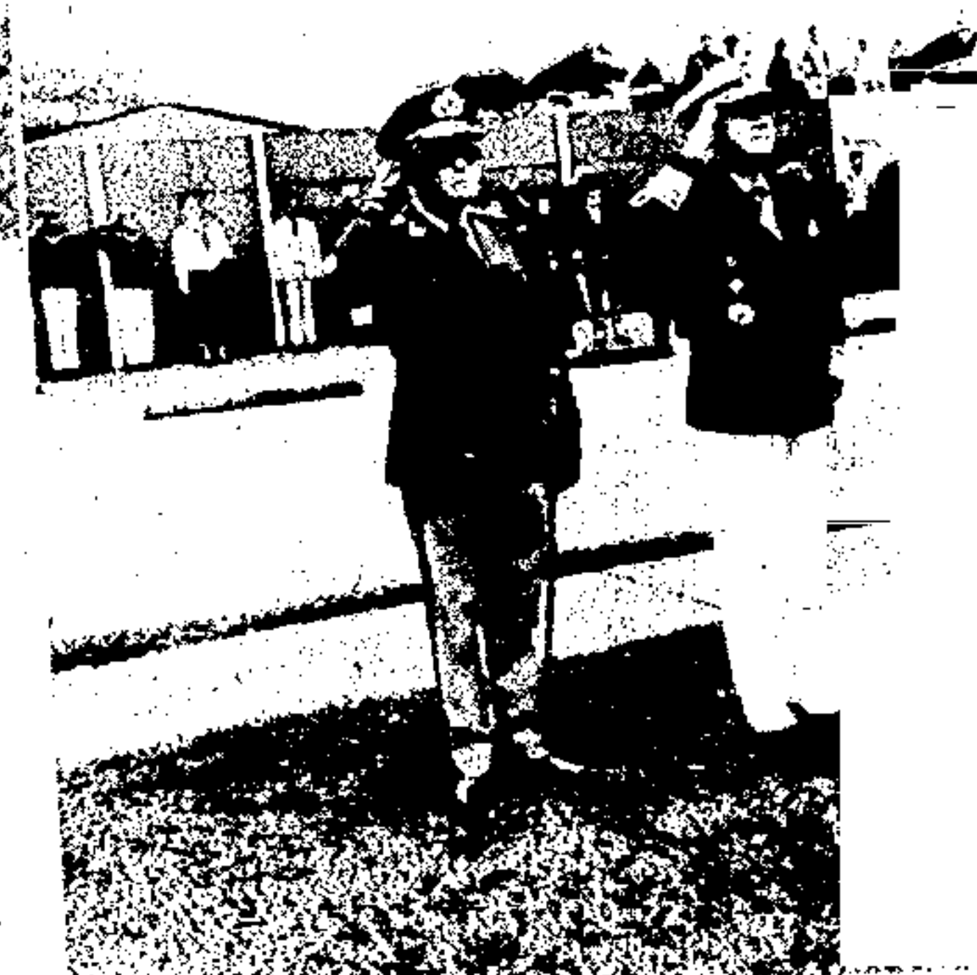
O magnífico Monumento ao Almirante Tamandaré, em São Paulo, prestigiaram a festa comemorativa.

Após a execução do Hino Nacional e o hasteamento da Bandeira, foram condecoradas várias personalidades civis e militares que, por suas