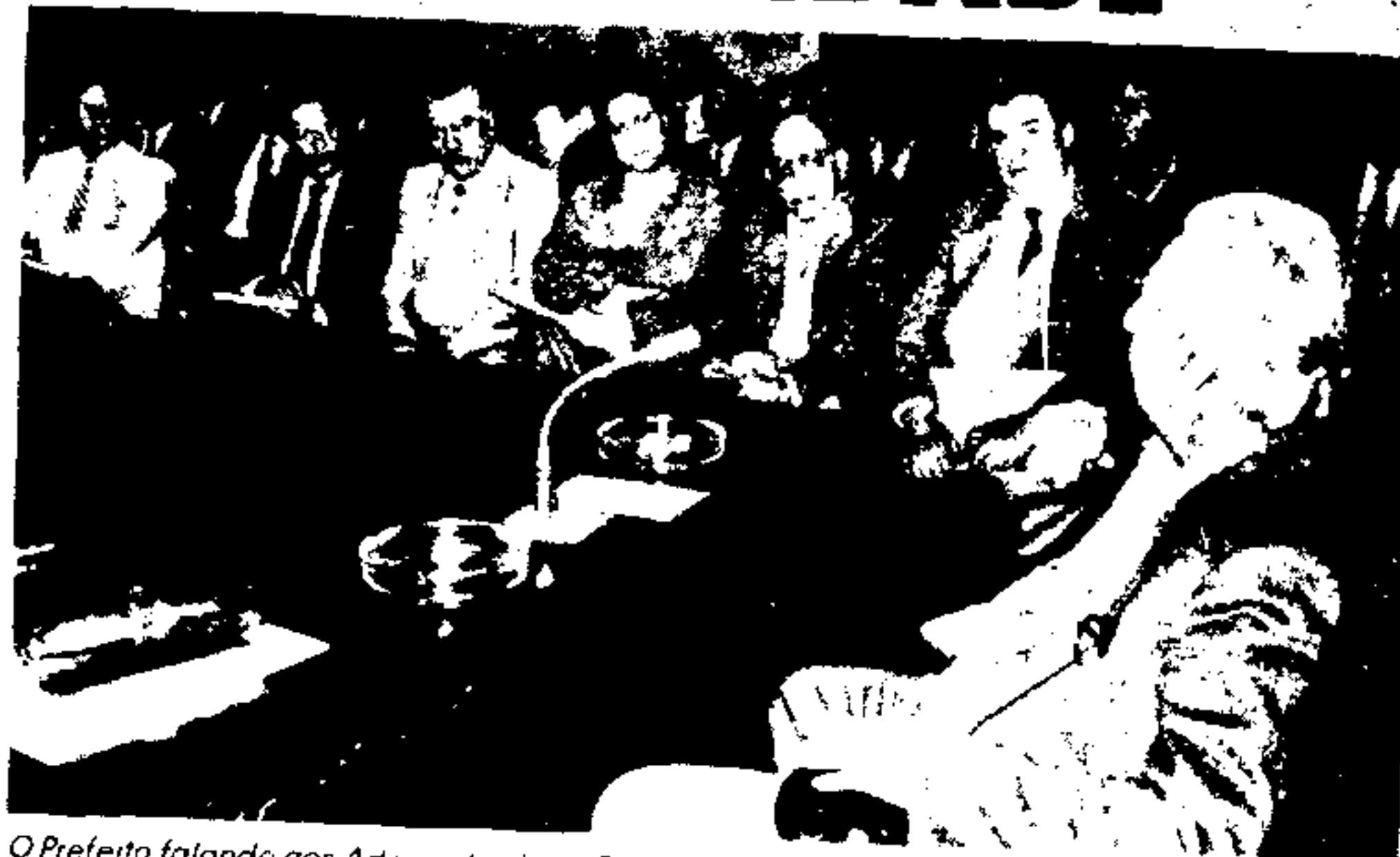
O Prefeito falando aos Administradores Regionais e dirigentes da Limpurb

Em reunião realizada em seu Gabinete com os Secretários de Serviços e Obras e das Administrações Regionais, além de Diretores da Limpurb e outros altos funcionários, o Prefeito Jânio Quadros exigiu o máximo rigor na limpeza da Cidade, tanto das ruas como dos estabelecimentos públicos, calçadas em bom estado e muros de fecho nos terrenos. E fez uma recomendação: "Maior rigor no zelo com a Cidade". Página 4