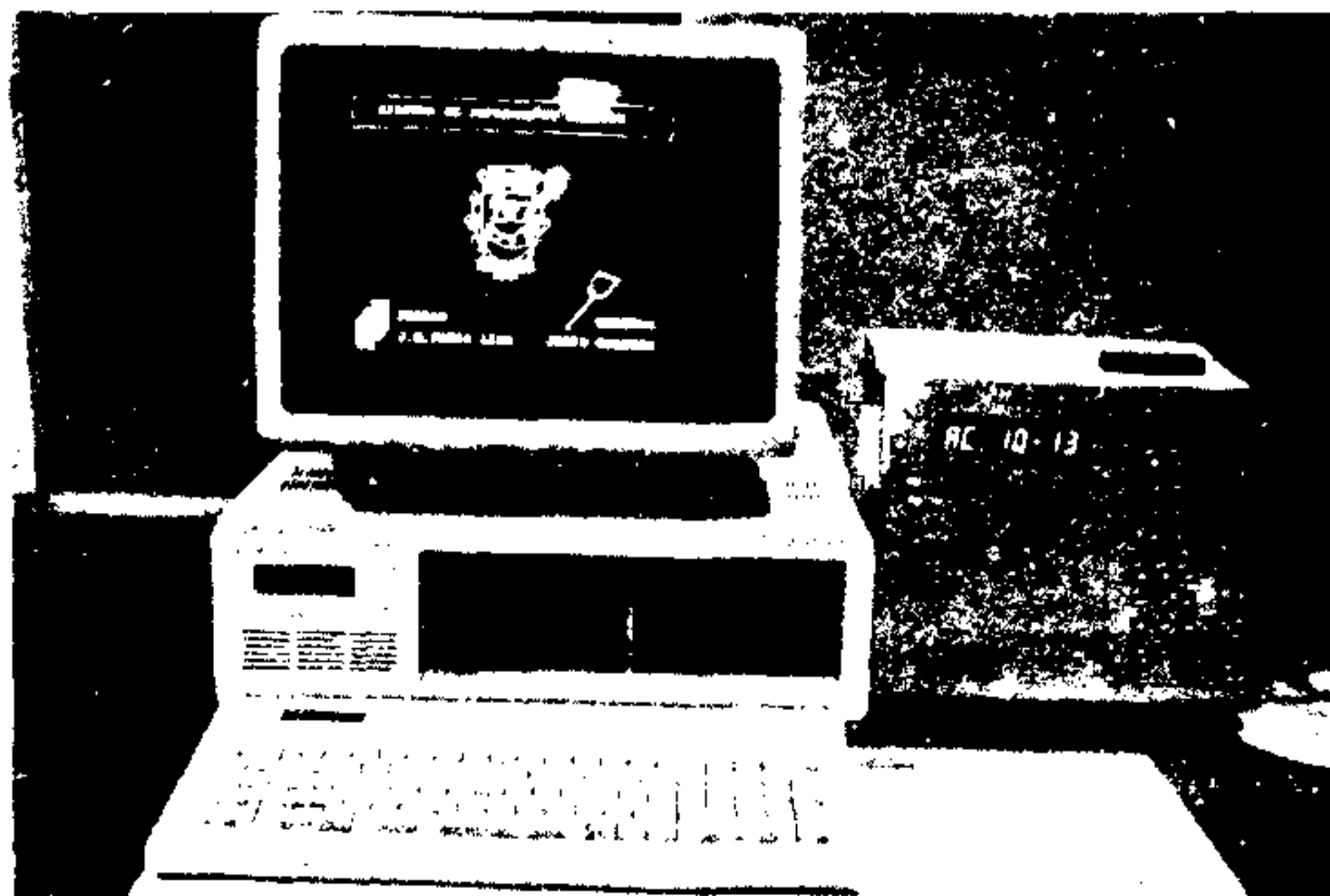
O sistema computadorizado já instalado no HSPM

A informática está chegando ao Hospital de Serviços Públicos Municipais, que dentro em breve contará com moderno sistema computadorizado para atender interessados e dar detalhes a respeito da saúde de pacientes. Este passo é o primeiro de uma série que permitirá atendimento até por telefone, e controlará a seleção do fluxo de pessoas dentro do prédio. Páginas 2 e 3