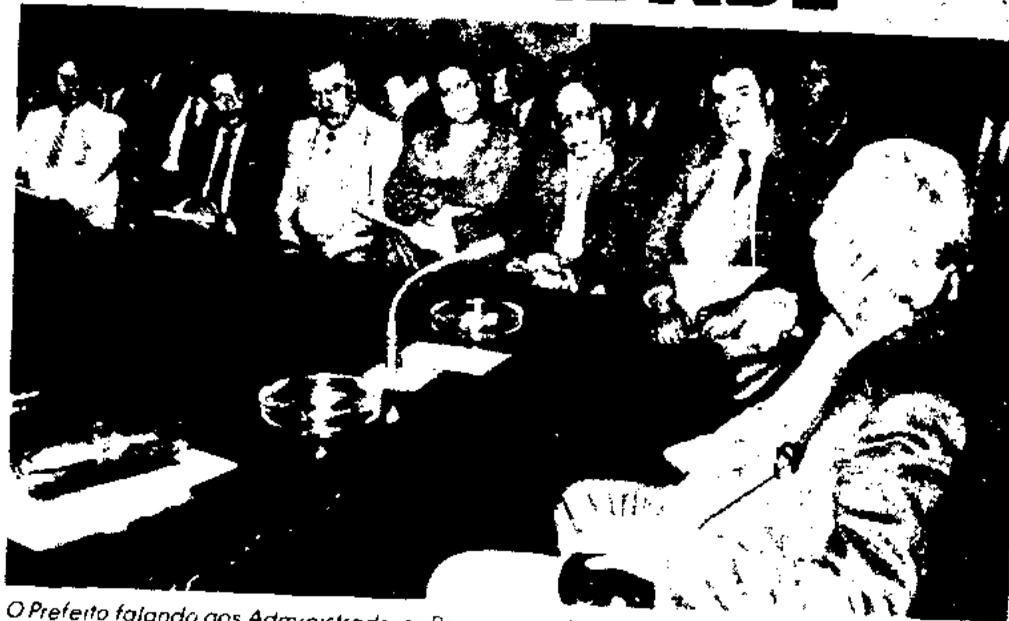
O Prefeito falando aos Administradores Regionais e dirigentes da Limpurb

Em reunião realizada em seu Gabinete com os Secretários de Serviços e Obras e das Administrações Regionais, além de Diretores da Limpurb e outros altos funcionários, o Prefeito Jânio Quadros exigiu o máximo rigor na limpeza da Cidade, tanto das ruas como dos estabelecimentos públicos, calçadas em bom estado e muros de fecho nos terrenos. E fez uma recomendação: "Maior rigor no zelo com a Cidade". Página 4