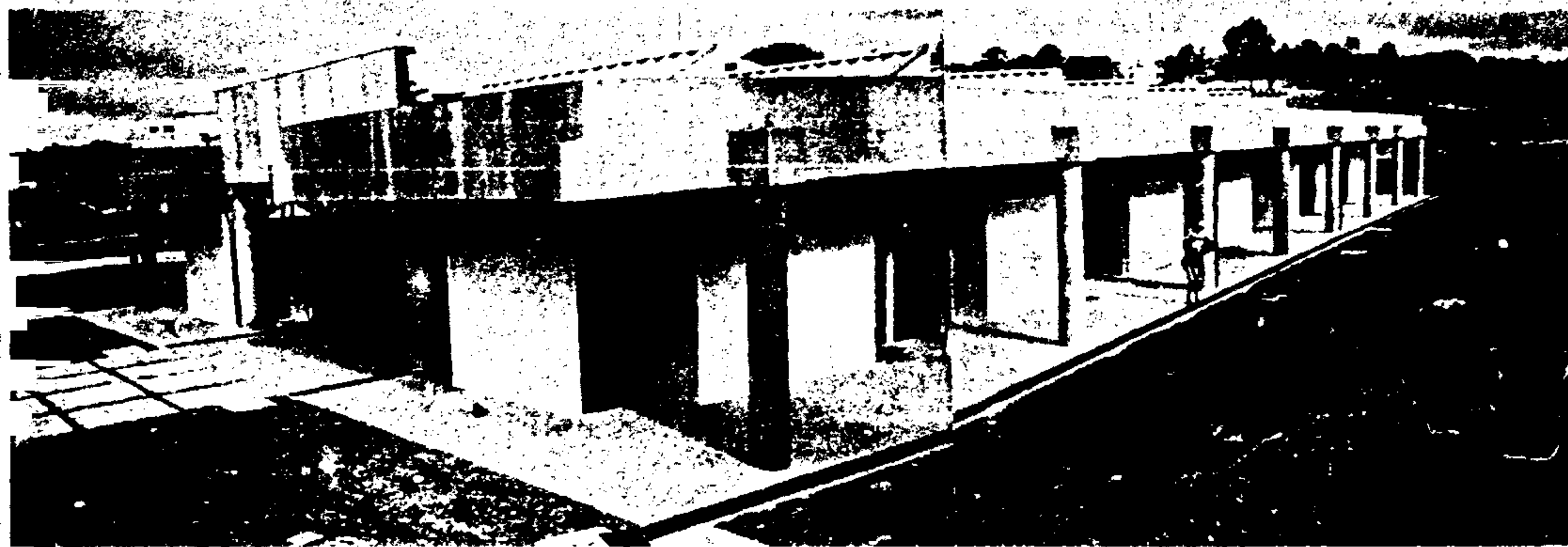
O velório está em fase de conclusão

O Superintendente do Serviço Funerário, Rubens da Costa, encaminhou ao Prefeito Jânio Quadros informações a respeito de críticas de um leitor, divulgadas pelo "Jornal da Tarde", em relação ao Cemitério de Vila Formosa.