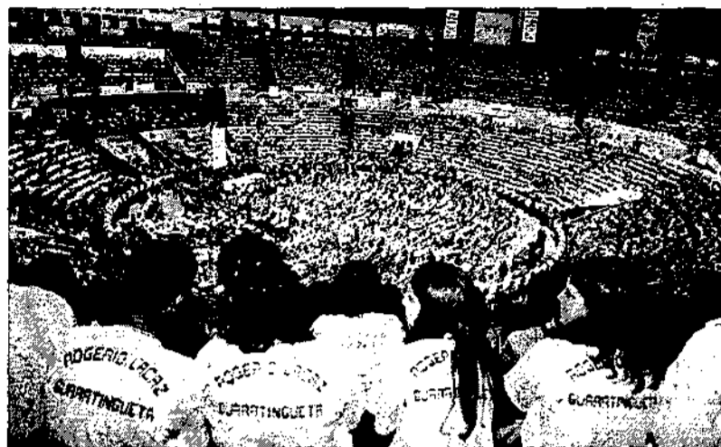
Mais de dez mil pessoas participaram da entrega dos prêmios