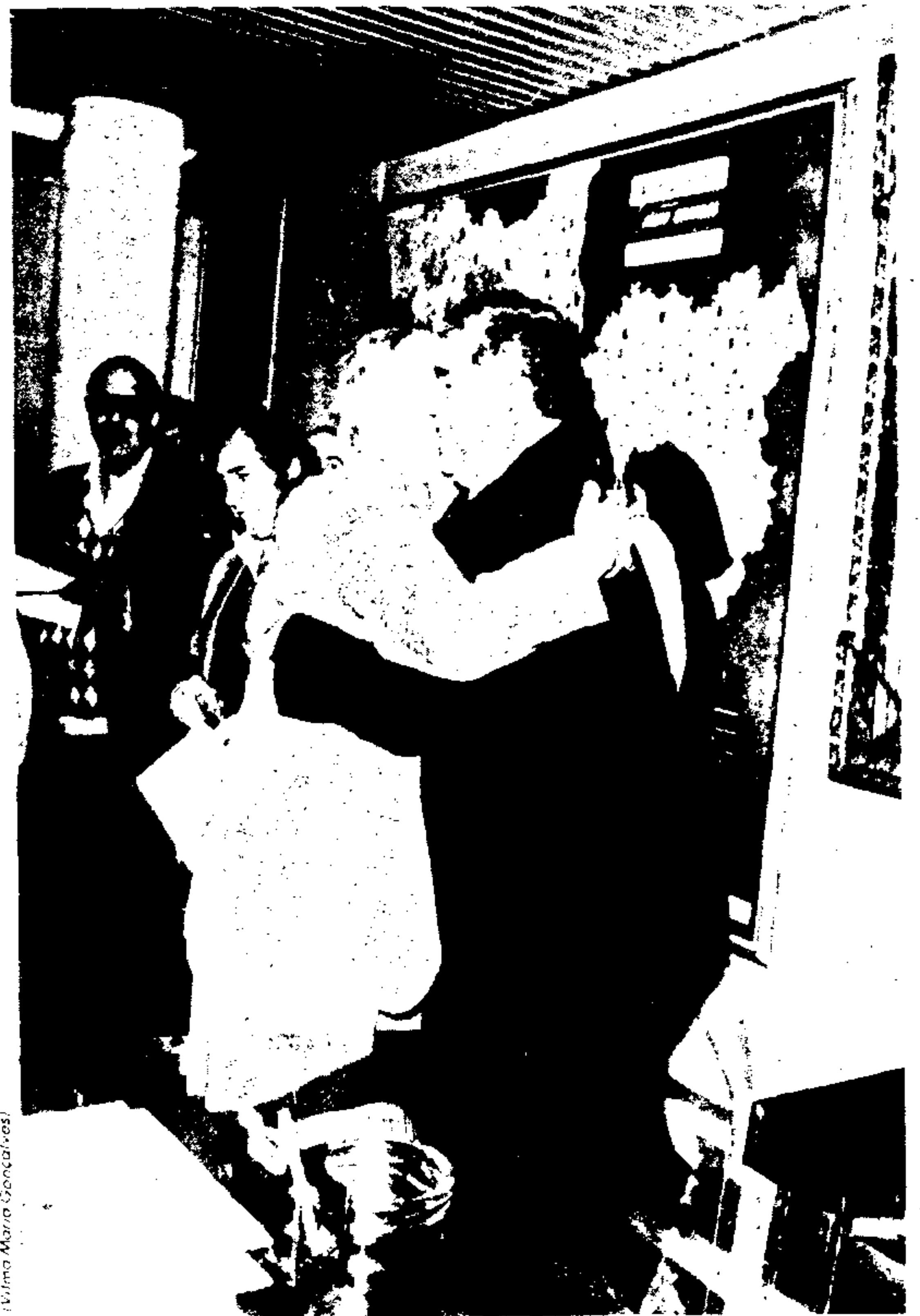
O abraço amistoso abriu o encontro entre o Prefeito Jânio Quadros e o Governador Newton Cardoso

A seguir, destaca o Prefeito que "O Estado e a Cidade merecem atenção especial que Vossa Excelência e o ilustre Ministro Mailson têm oferecido sob pena de graves conseqüências para a Nação que Vossa Excelência dirige, exigindo em contrapartida somente civismo, respeito e lealdade a nossos interesses superiores".