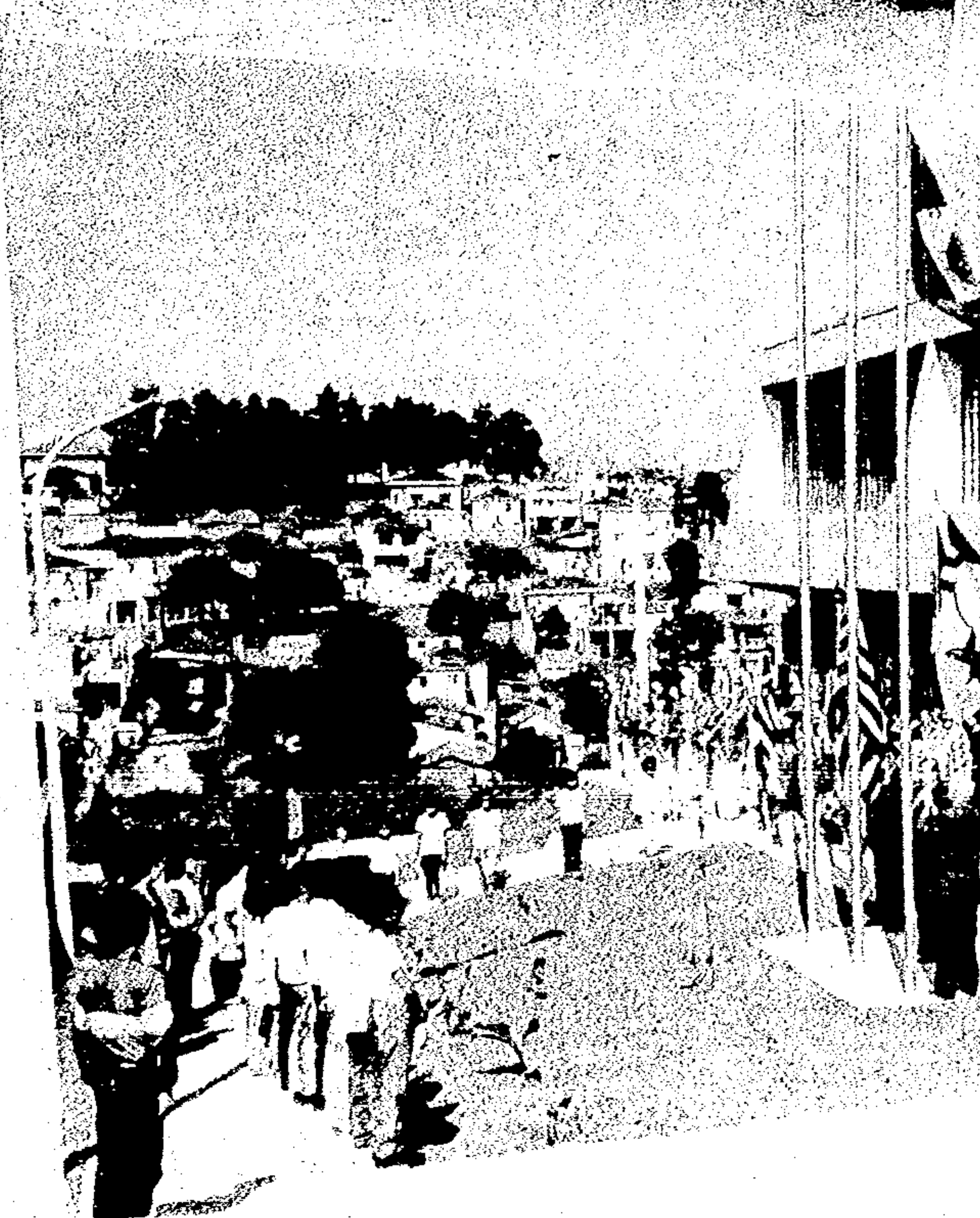
Um dos modernos prédios construídos durante a Administração Jânio Quadros, para atender áreas necessitadas ou substituir barracões como os do detalhe, impróprios para estudantes.