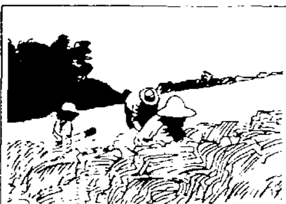
SENAR Serviço Nacional de Formação Profissional Rural