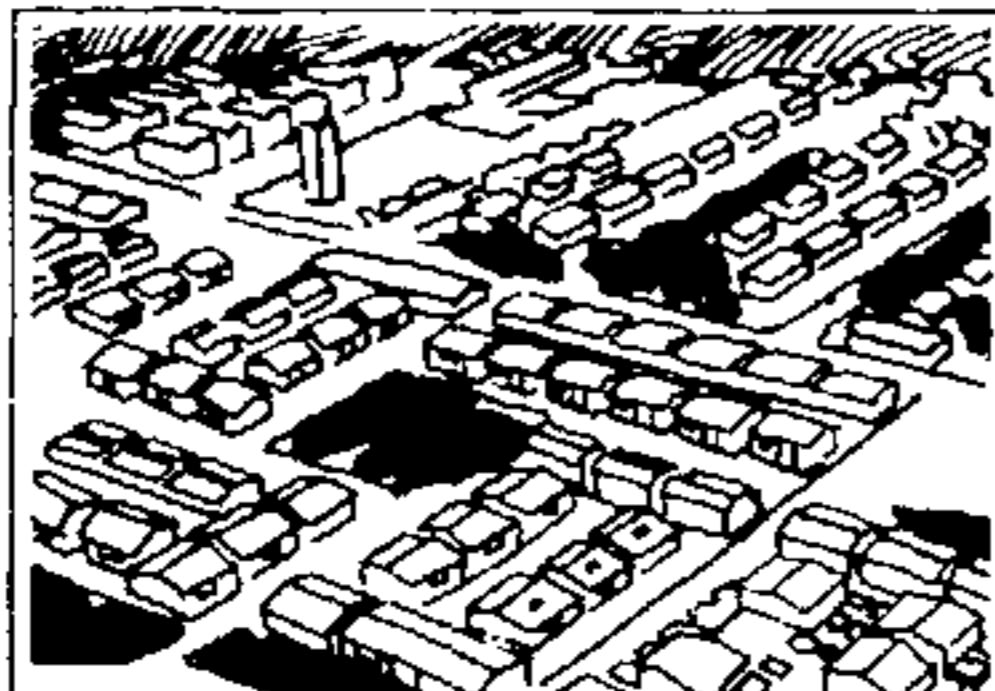
PROSINDI Programa de Habitação para o Trabalhador Sindicalizado.