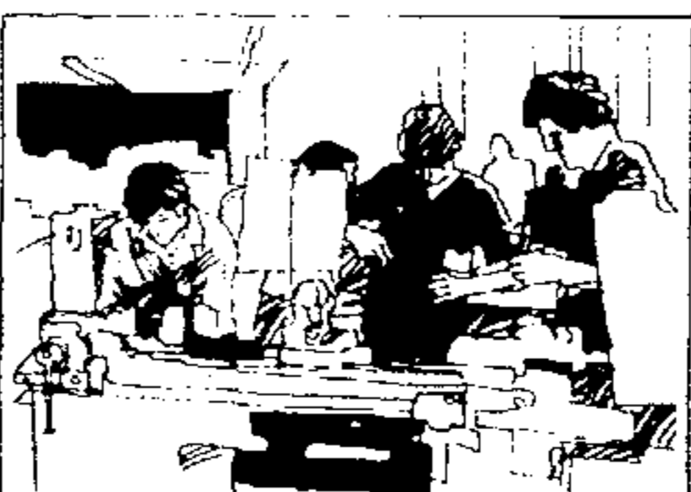
SNFMO Sistema Nacional de Formação de Mão-de-Obra.

“ Mas é sobretudo no campo social, acima de tudo nos investimentos feitos no homem e para seu bem-estar, que verdadeiramente realizaremos a independência nacional. Por assim julgar, desejo deixar bem claro que o pensamento e a ação do meu governo não se realizam só nas construções, nas obras e nos edifícios, nas fábricas e nas máquinas, nas usinas e nos geradores.