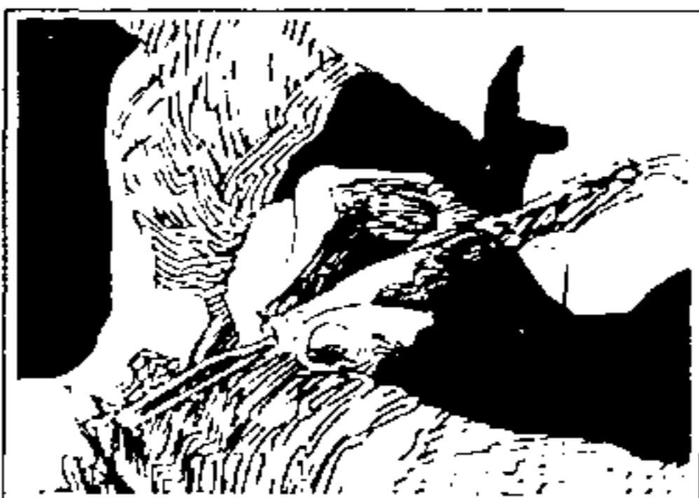
PNDA Programa Nacional de Desenvolvimento do Artesanato.