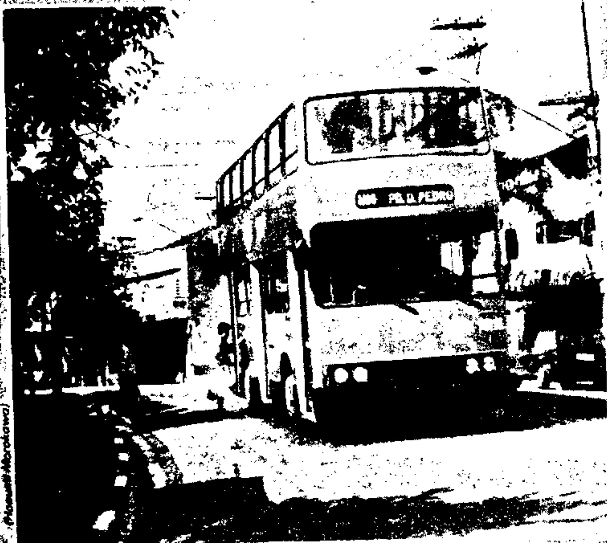
Linha 2165 Jardim Japão-Parque Dom Pedro, passando pela Vila Maria.