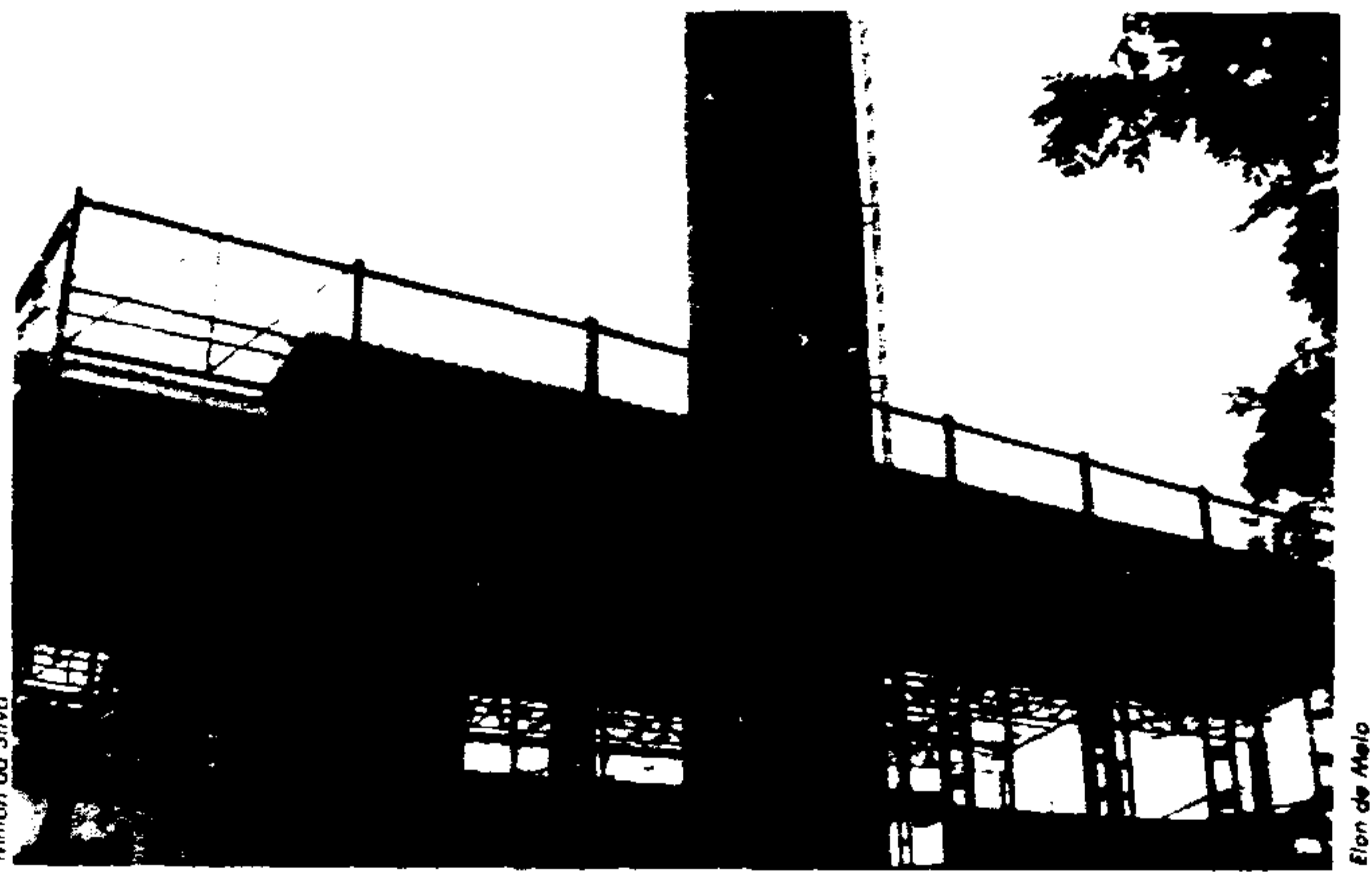
Minimercado do Jardim Peri-Peri

A Secretaria Municipal de Abastecimento desenvolve extenso programa de obras, em fase de rápida execução, de acordo com as recomendações do Prefeito Jânio Quadros, de acelerar ao máximo os trabalhos, a fim de que a população possa beneficiar-se o mais breve possível das dependências e serviços.