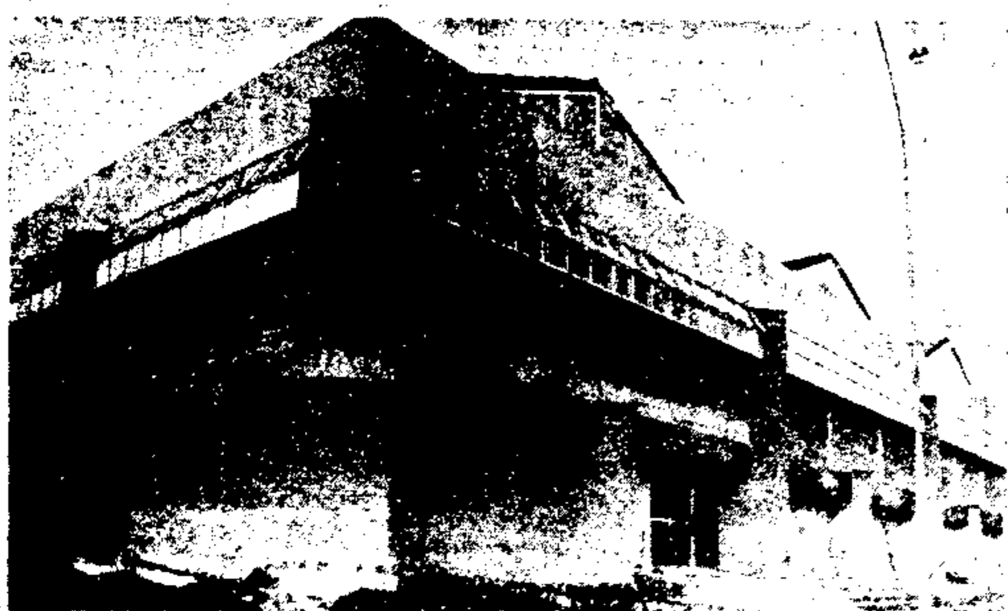
O Mercado Municipal de Guaianases, cujas obras estão sendo apressadas pelo Secretário Celso Matsuda, do Abastecimento, e que em breve passará a prestar serviços à população local.

Os inimigos de São Paulo, que tudo têm feito, inutilmente, para prejudicar as realizações da atual Administração Municipal, foram denunciados em dois memorandos do Prefeito Jânio Quadros ao Secretário Walter Bodini, de Vias Públicas. Destacando o apoio dado à Cidade pelo Governador Orestes Quércia e pelo Presidente José Sarney, desafia o Prefeito: "Estrebuchem! Pois nada conseguirão e as obras vão prosseguir, com inaugurações e benefícios para todos os bairros." Páginas 2 e 3