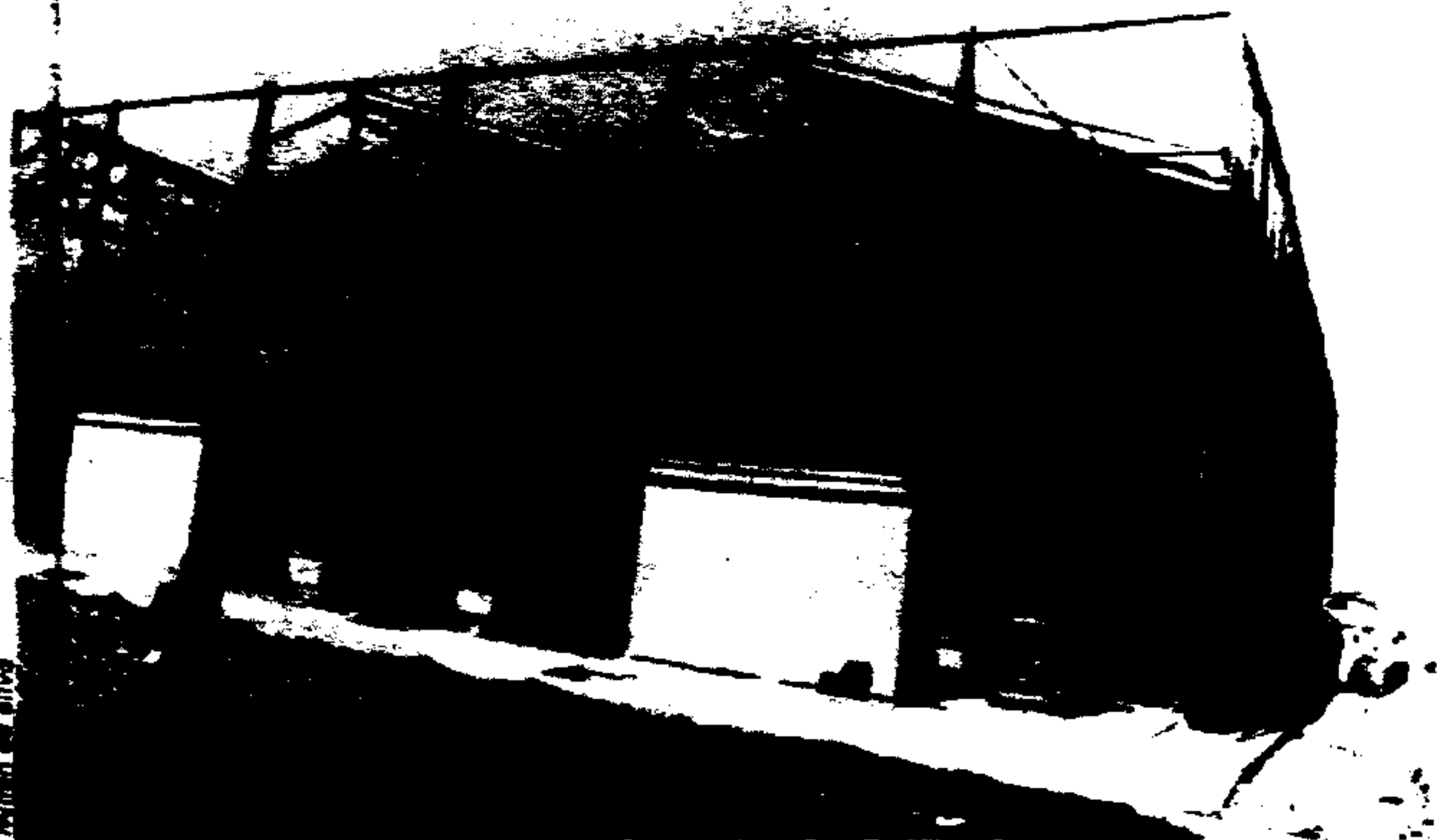
Minimercado da Japôni