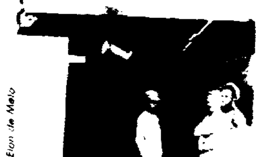
Elton de Melo