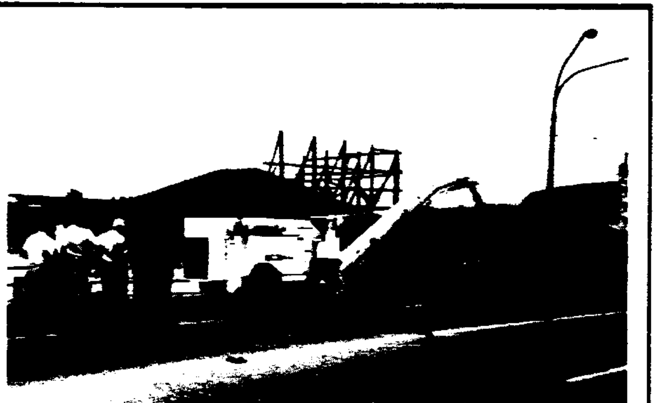
Máquinas modernas e boa mão-de-obra ajudam a Prefeitura a bater todos os recordes de pavimentação.

"Não ameacem. Façam-no.", desafia o Chefe do Executivo, destacando ser uma "pena que ignorem as Leis, inclusive as penais. Nada construiram. E só não destruíram porque o Prefeito não o permitiu."