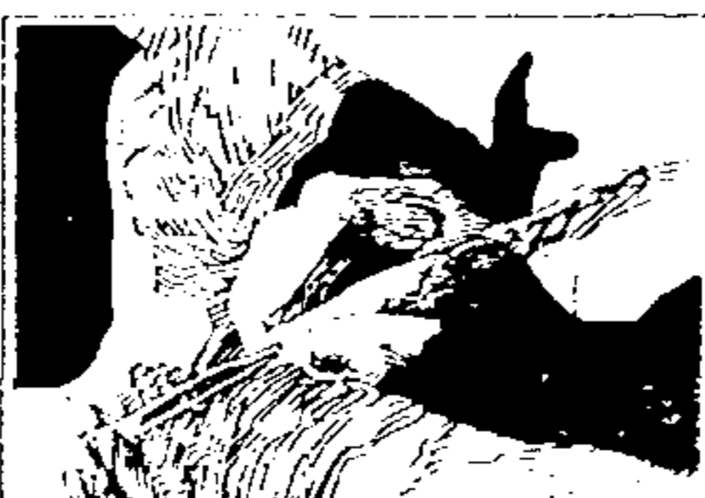
PNDA Programa Nacional de Desenvolvimento do Artesanato.