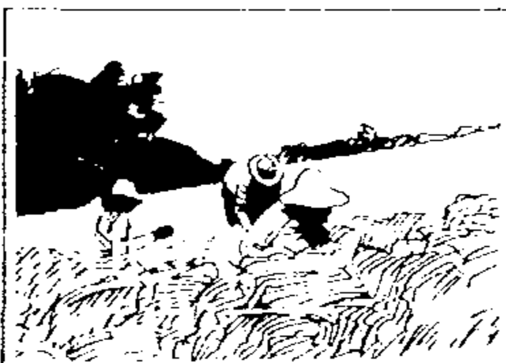
SENAR Serviço Nacional de Formação Profissional Rural