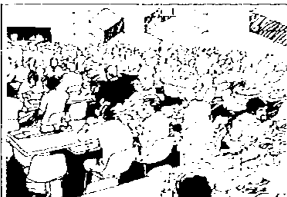
PAT Programa de Alimentação do Trabalhador.