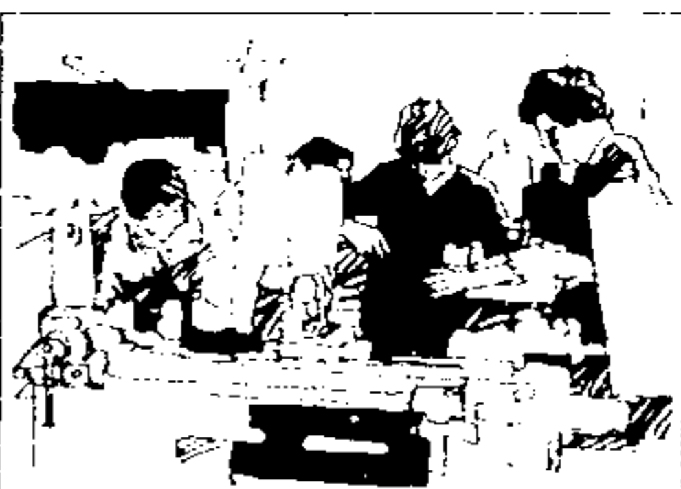
SNFMO Sistema Nacional de Formação de Mão-de-Obra.

“ Mas é sobretudo no campo social, acima de tudo nos investimentos feitos no homem e para seu bem-estar, que verdadeiramente realizaremos a independência nacional. Por assim julgar, desejo deixar bem claro que o pensamento e a ação do meu governo não se realizam só nas construções, nas obras e nos edifícios, nas fábricas e nas máquinas, nas usinas e nos geradores.