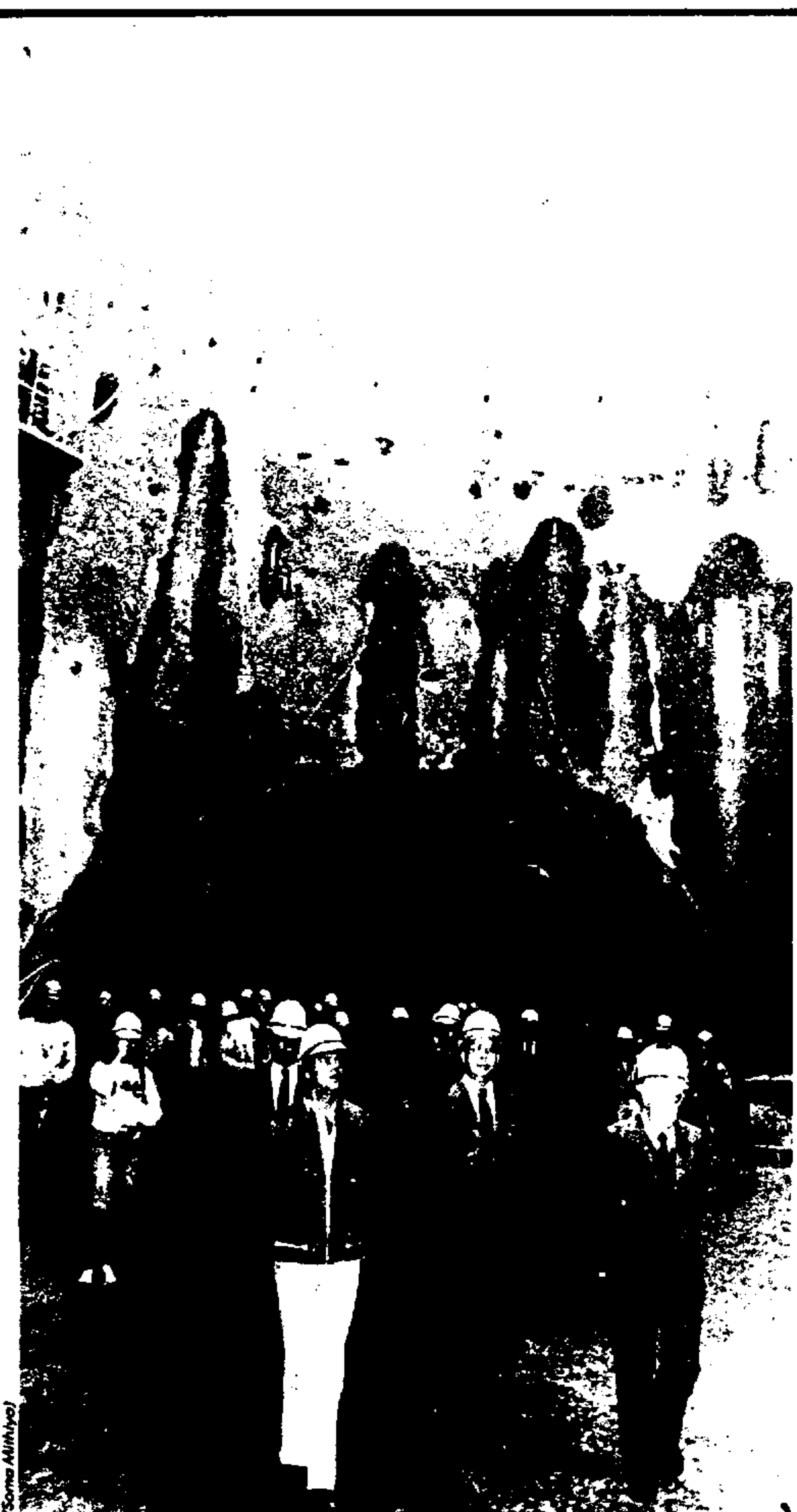
O ritmo rápido das escavações sob o Parque do Ibirapuera impressionou os jornalistas