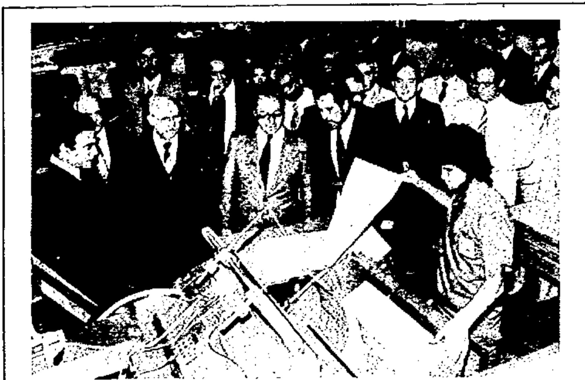
No pavilhão de Artes Gráficas, a atenção do Governador do Estado foi despertada para as máquinas de impressão em Braille. Três obras já foram editadas pela IMESP para os deficientes visuais.