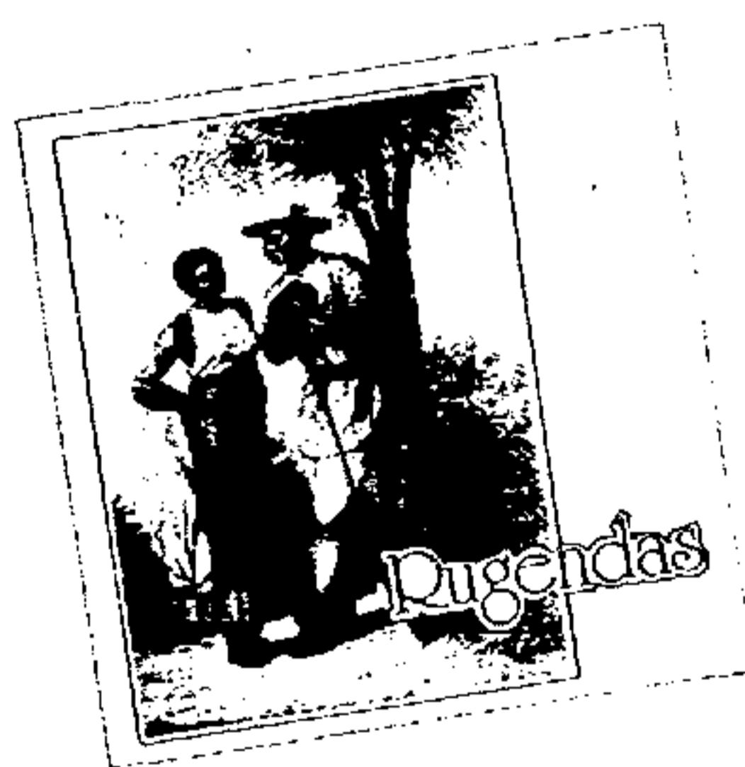
Fac-simile da capa da edição de Rugendas, com o traço inigualável do desenhista de paisagens brasileiras, de nossos índios e nossos negros.