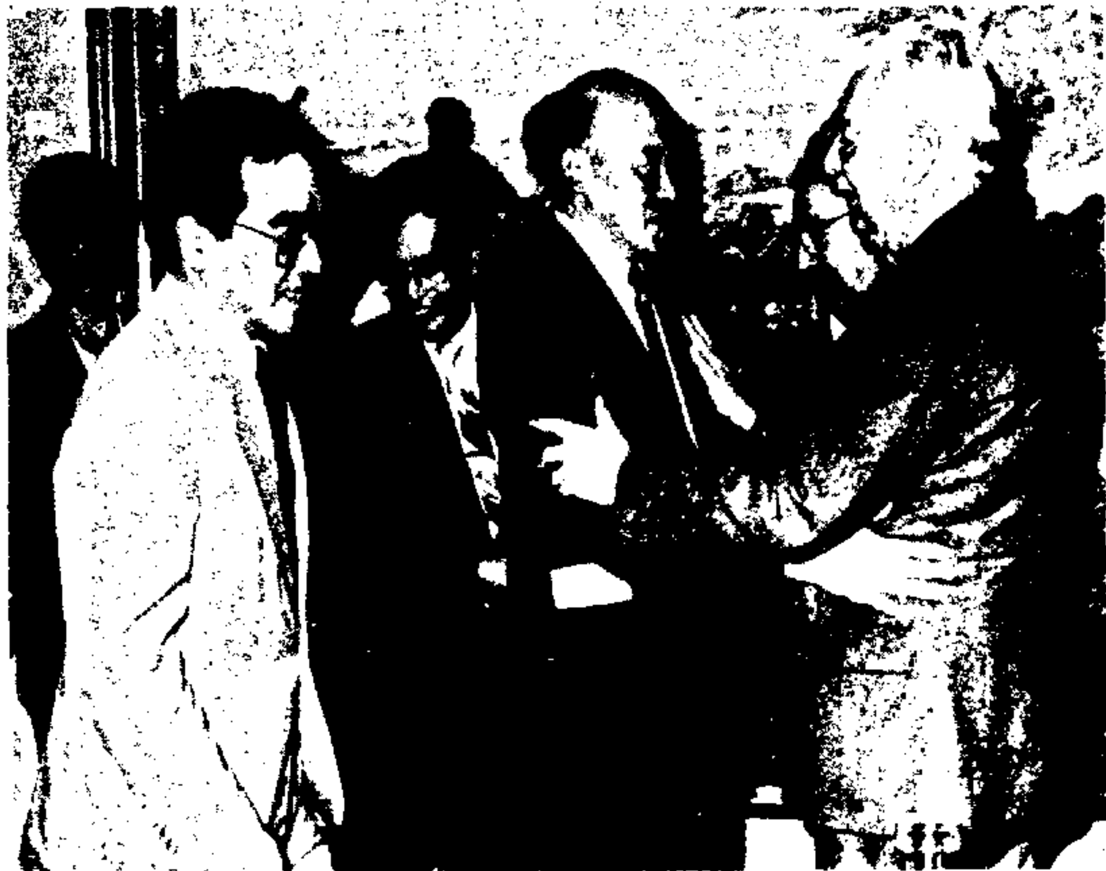
O Prefeito Jânio Quadros cumprimentando líderes rurais e os cinco produtores premiados