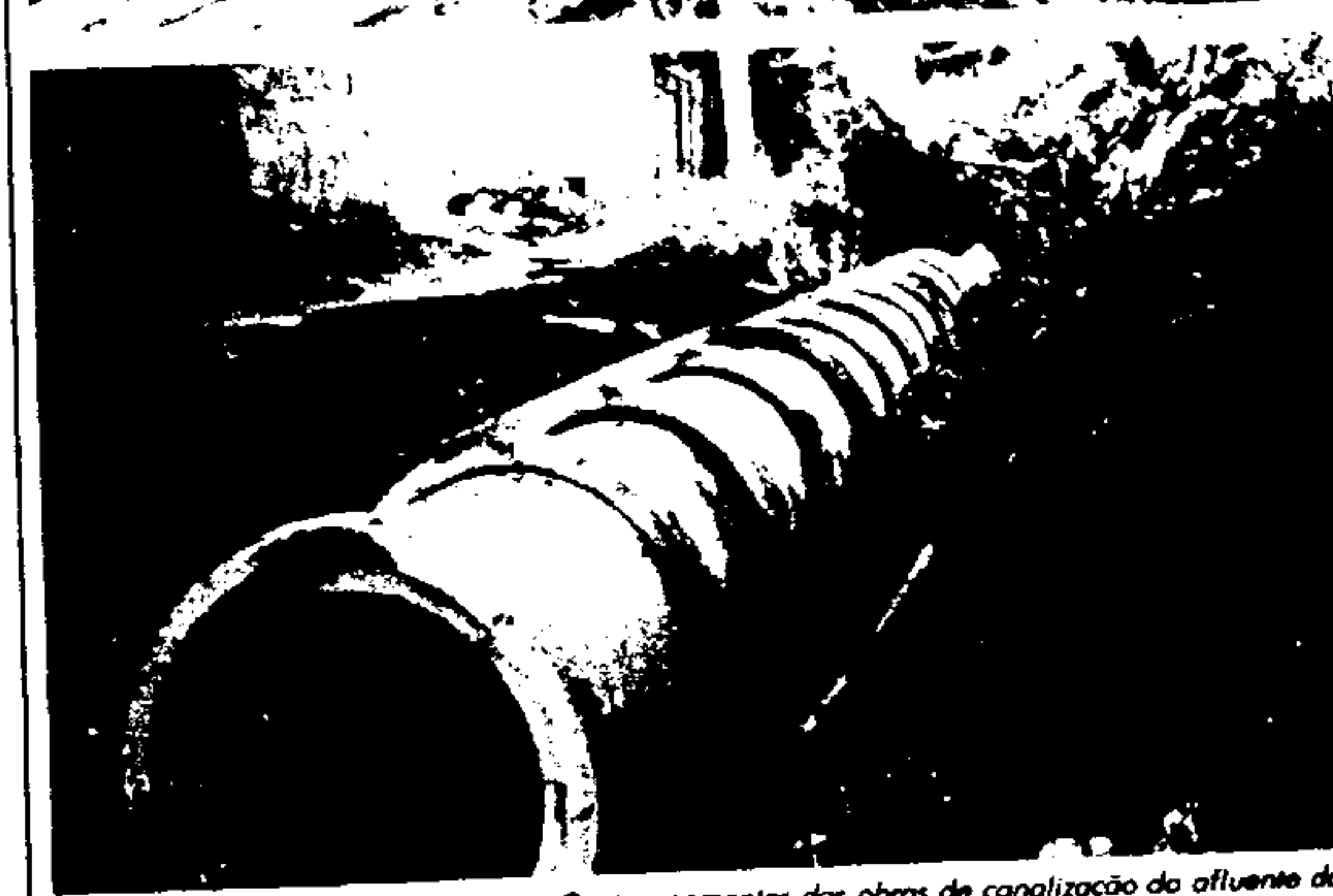
Quatro momentos das obras de canalização do afluente da Corrente, abaixo os tubos de concreto já instalados.

Utilizando máquinas e mão-de-obra do Município, a Secretaria das Administrações Regionais tem executado várias importantes obras na Cidade, as quais, além de resolver problemas cruciais para as regiões onde ocorrem, representam economia de custo para os cofres públicos, já que sairiam muito mais caras se entregues a empresas particulares.