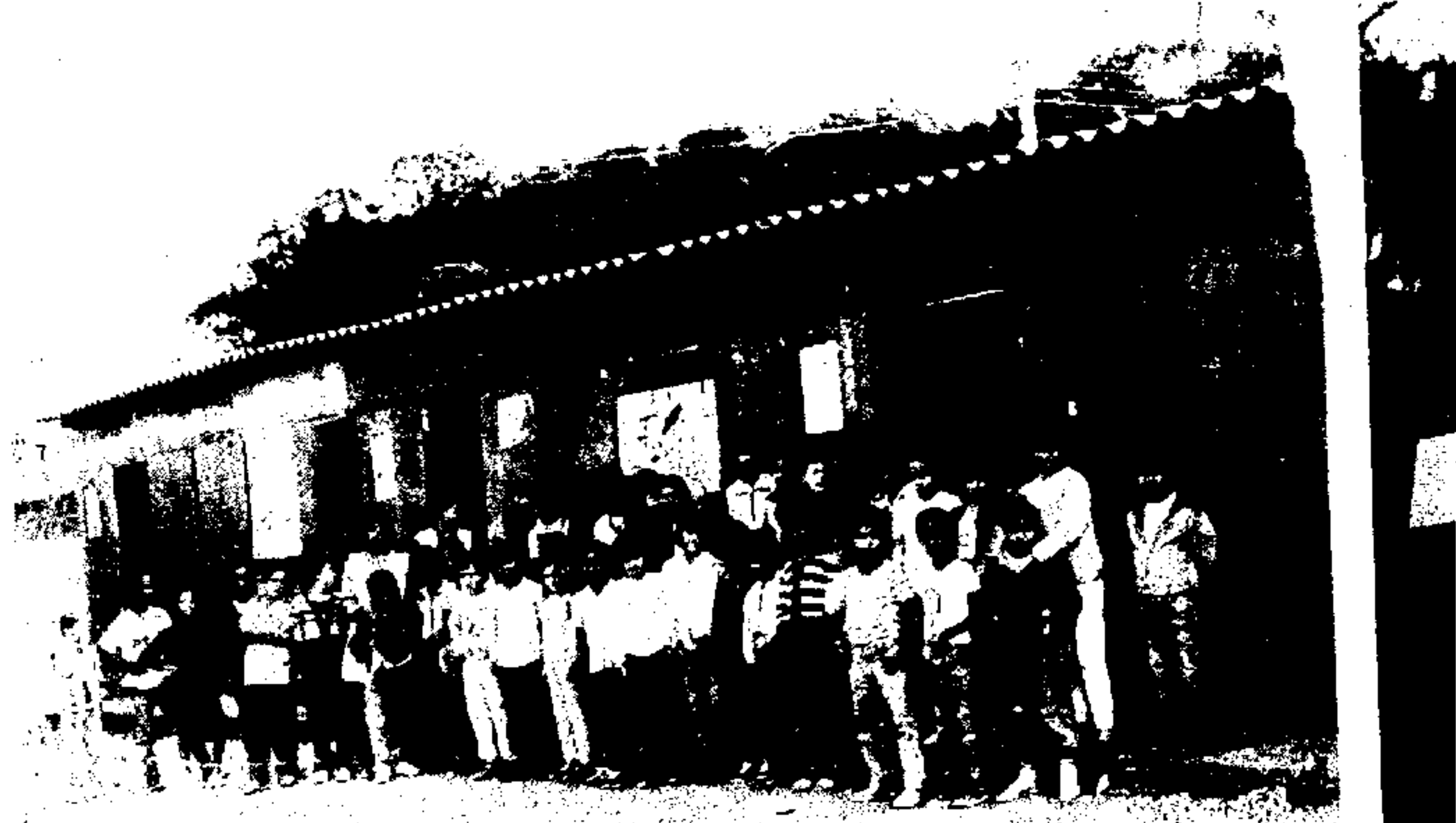
As fotos falam mais que as palavras: os alunos deixando pela última vez a nova escola construída pela atual Administração.