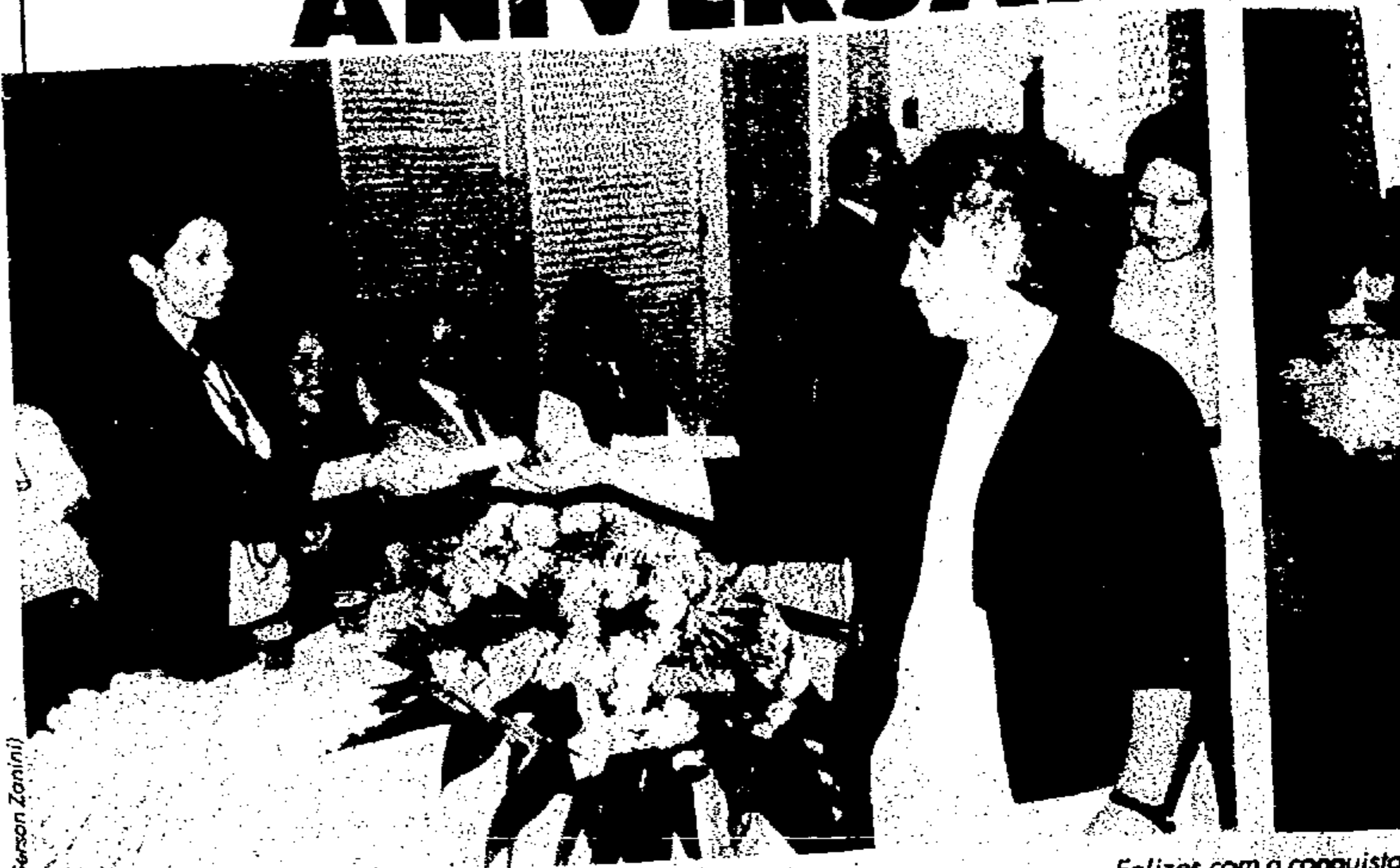
Felizes com a conquista, alunos recebem seus certificados de conclusão de curso.

Aproveitando a passagem do décimo aniversário de sua criação, a Delegacia Regional de Serviço Social do Ipiranga realizou a solenidade de formatura dos educandos que concluíram os cursos do Programa de Assistência à Mão-de-Obra, mantido pela Secretaria do Bem-Estar Social.