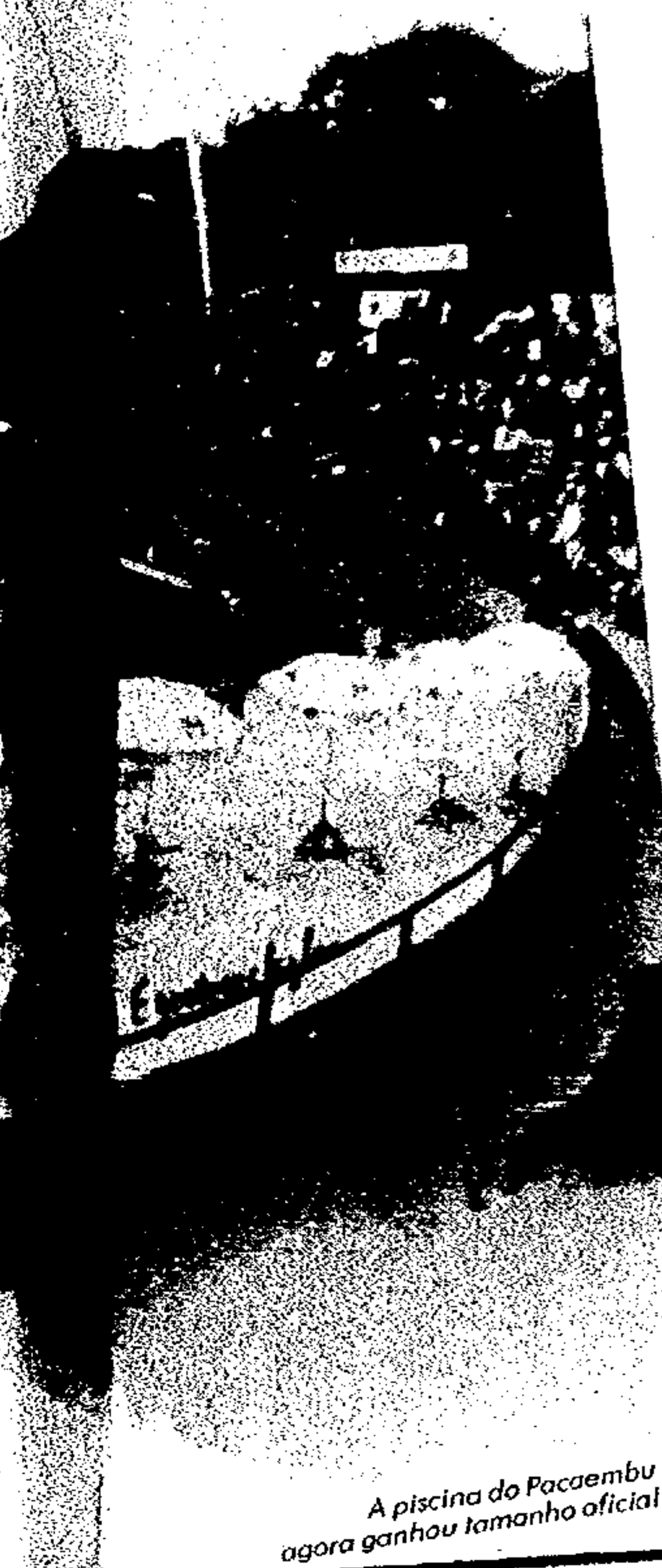
A piscina do Pacaembu agora ganhou tamanho oficial

Na área abrangida pela Secretaria de Esportes, a Administração Jânio Quadros construiu e entregou ao uso público o Balneário do Jardim Celeste, localizado na Rua Edward Camilo. Além disso, encontra-se em fase final de obras, com entrega prevista até o dia 31 do corrente mês de dezembro, o Balneário de Santana, instalado na Avenida Santos Dumont, havendo ainda um terceiro em fase de licitação. Merece destaque, outrossim, a reforma realizada no Estádio Municipal Paulo Machado de Carvalho, o velho Pacaembu, e no conjunto aquático a ele anexo. A praça de futebol ganhou novo visual, amplamente recuperada e com as diversas seções destacadas em cores distintas, facilitando a localização e melhorando sobremaneira o aspecto. A piscina olímpica, que se encontrava totalmente superada, foi modernizada e pode agora acolher qualquer competição internacional. A Secretaria de Esportes recuperou e manteve todo o equipamento esportivo espalhado pelos diversos bairros, e patrocinou ou orientou centenas de promoções esportivas que congregaram atletas amadores e profissionais.