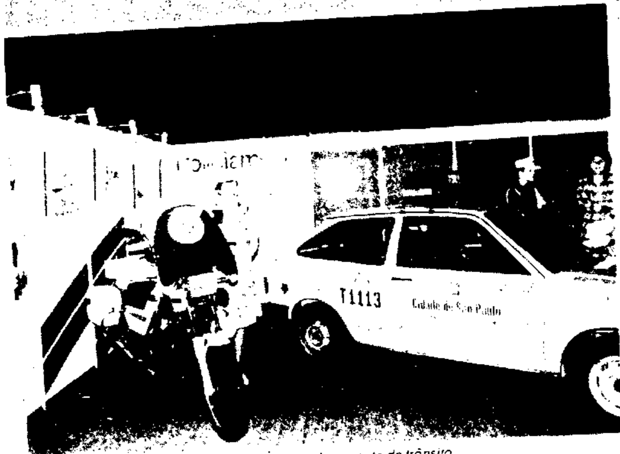
Moto e viatura de policiamento de trânsito