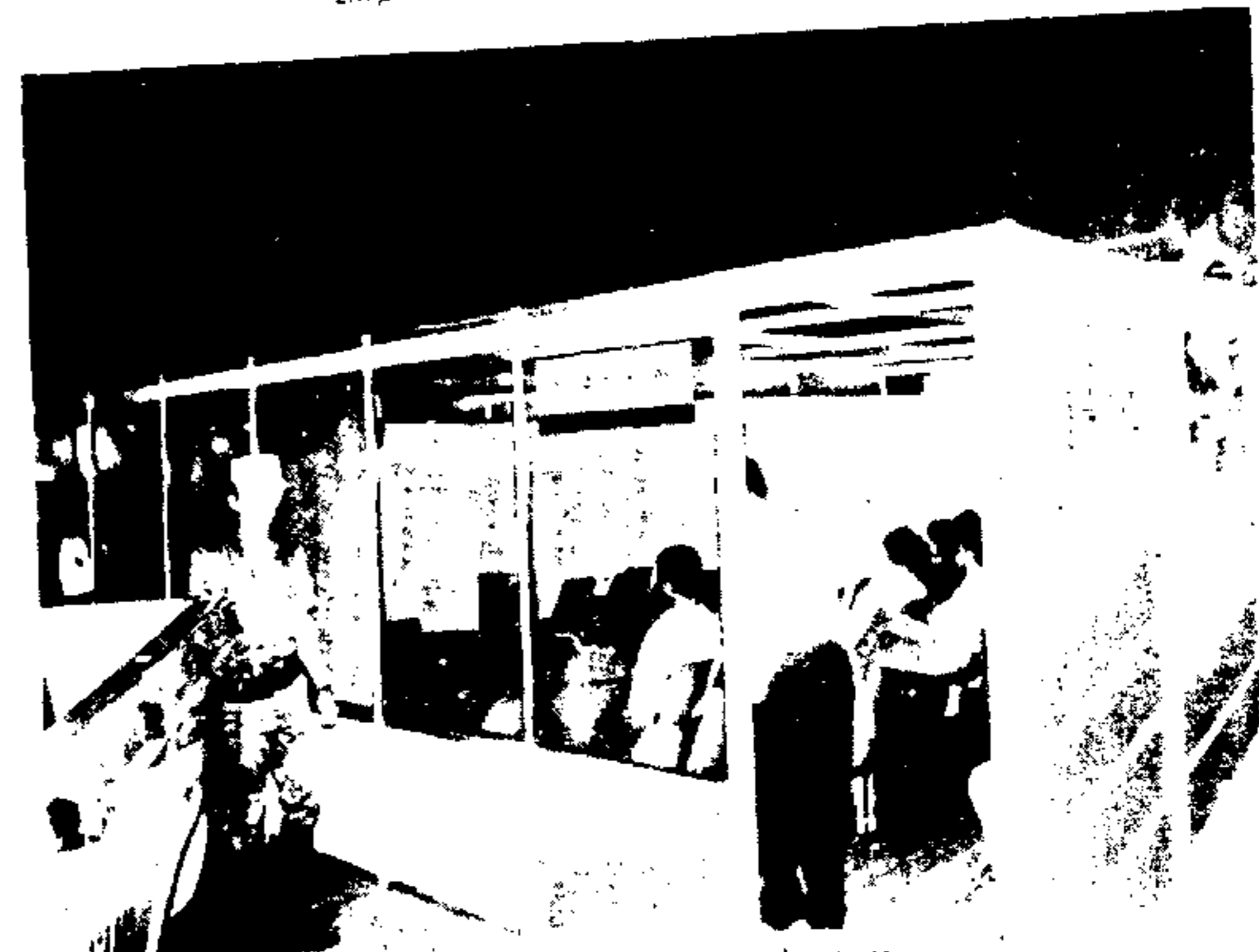
Sala de projeções de filmes educativos

Vem alcançando o maior sucesso entre os milhares de visitantes do Salão do Automóvel e Autopeças 88, que se realiza no Parque Anhembi, até o próximo domingo, dia 23, o estande montado pela Secretaria Municipal de Transportes, no qual são dadas a conhecer ao público algumas das atividades desenvolvidas pelos seus órgãos.