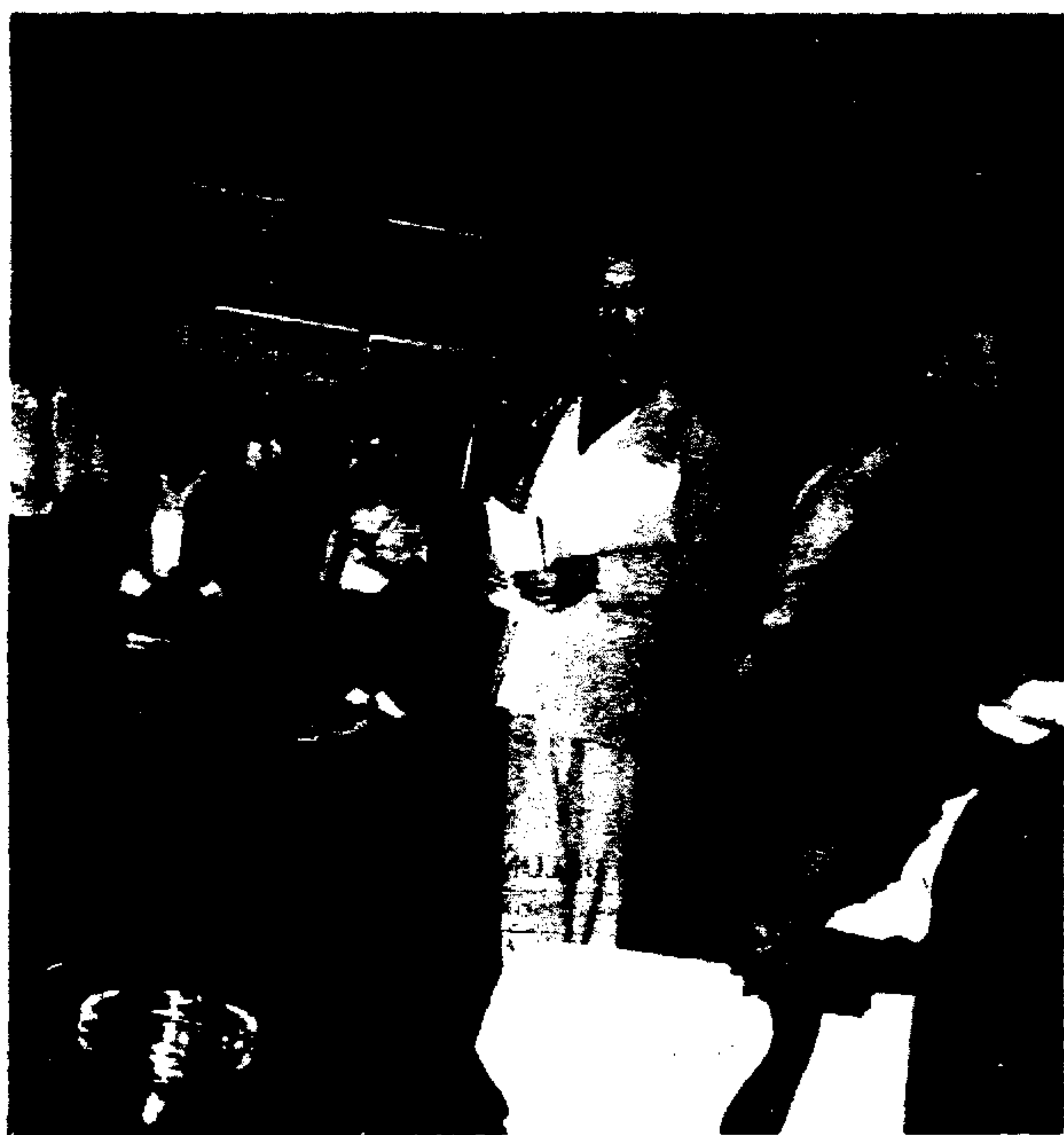
Vereadores e dirigentes das SABs prestigiaram o ato, manifestando gratidão ao Prefeito.

de setembro, e 5 veículos amarelos, modelo executivo. Estes carros têm capacidade para 40 passageiros sentados, em poltronas de luxo. Com estes cinco ônibus, já são 21 reencarroçados, dos 129 que terão o mesmo tratamento até o final de setembro. Todos os novos carros foram observados pelo Prefeito Jânio Quadros, que se fazia acompanhar do presidente da CMTC, Antonio João Pereira, e de outras autoridades.