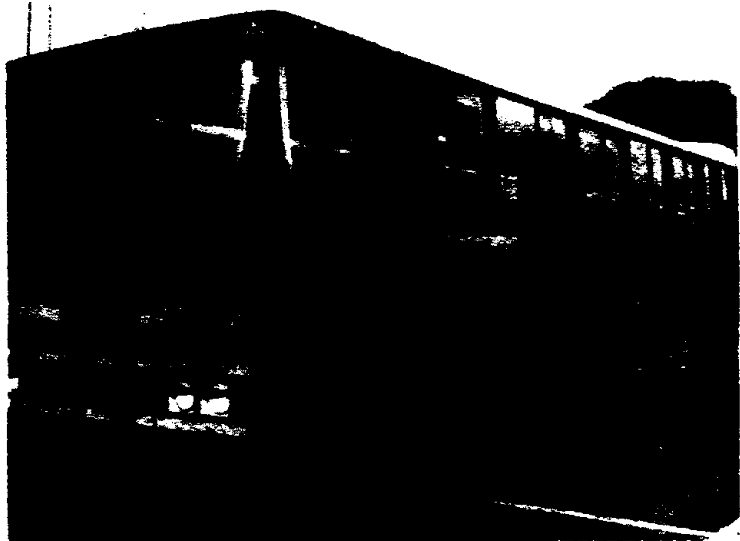
Os "amarelinhas" são utilizados nas linhas "Executivas", com tarifa especial.

de setembro, e 5 veículos amarelos, modelo executivo. Estes carros têm capacidade para 40 passageiros sentados, em poltronas de luxo. Com estes cinco ônibus, já são 21 reencarroçados, dos 129 que terão o mesmo tratamento até o final de setembro. Todos os novos carros foram observados pelo Prefeito Jânio Quadros, que se fazia acompanhar do presidente da CMTC, Antonio João Pereira, e de outras autoridades.