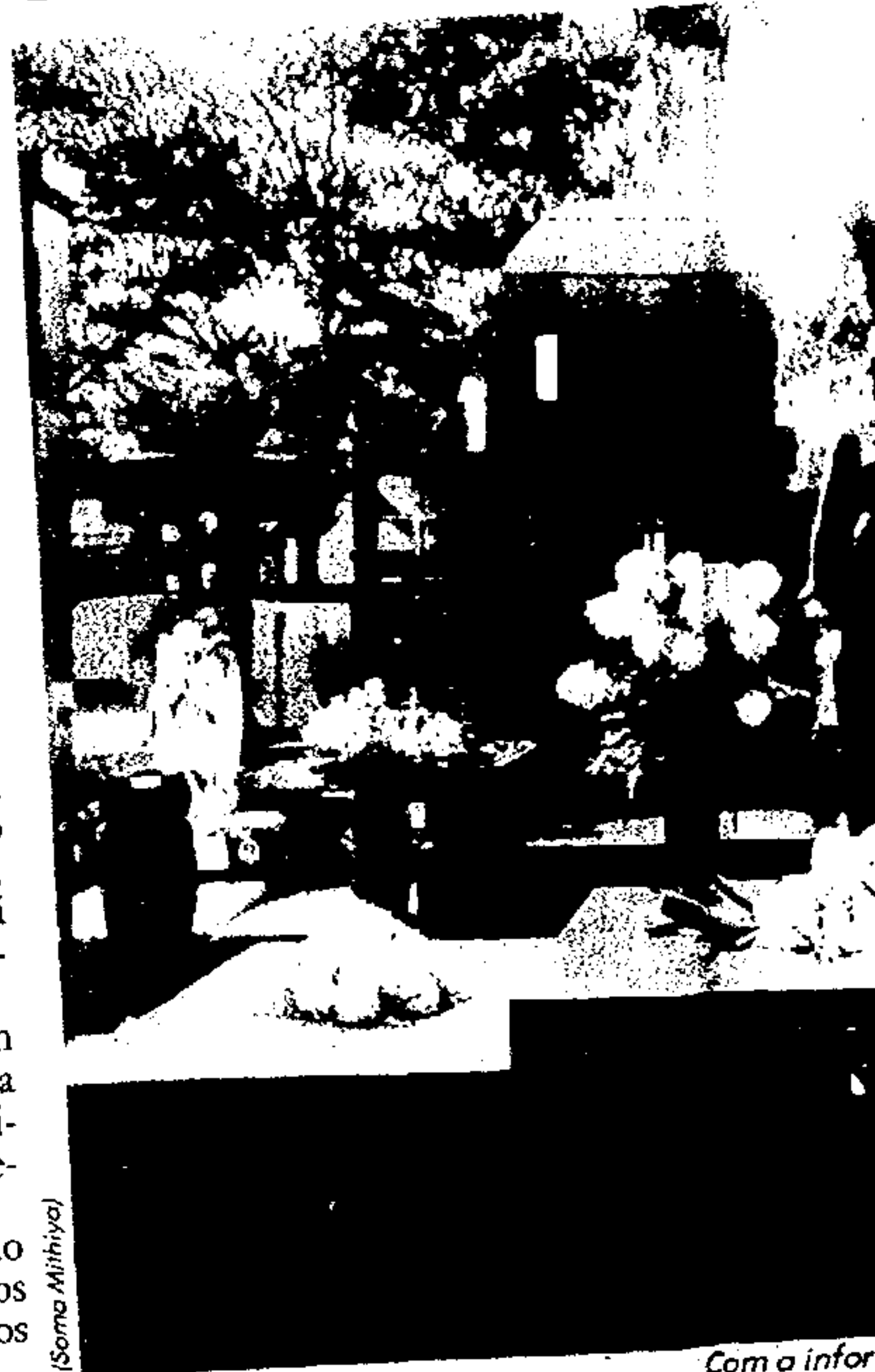
Com a infor va

A partir da informatização do Serviço Funerário Municipal, todos os preparativos para sepultamentos serão feitos num único local.