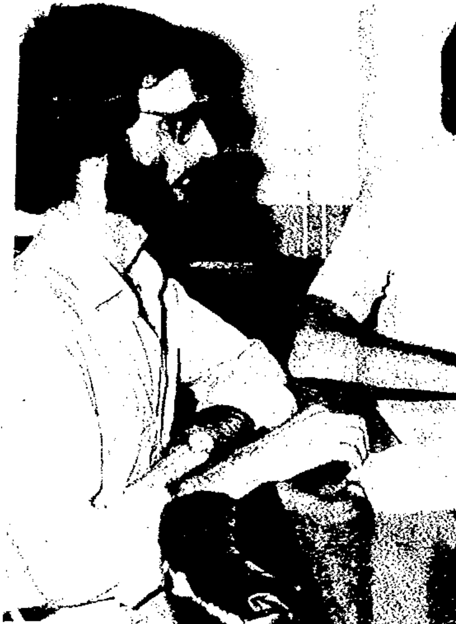
Lolhar Bazan coordenaram Ambos s

O Centro Cultural São Paulo, uma das bibliotecas mais modernas do País, será o primeiro a utilizar o Estrela D'Alva.