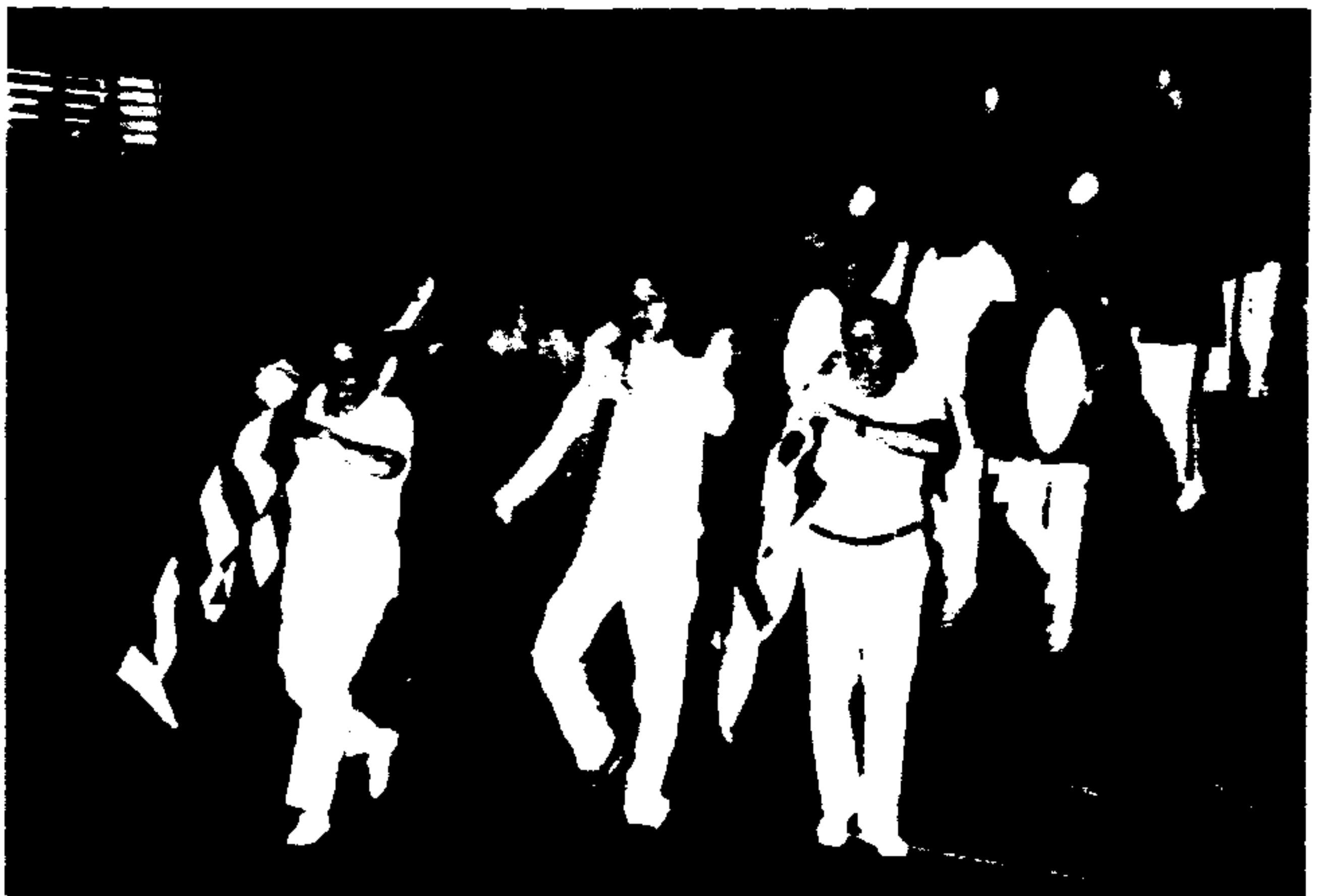
Quatro flagrantes da magnífica festa da juventude paulistana