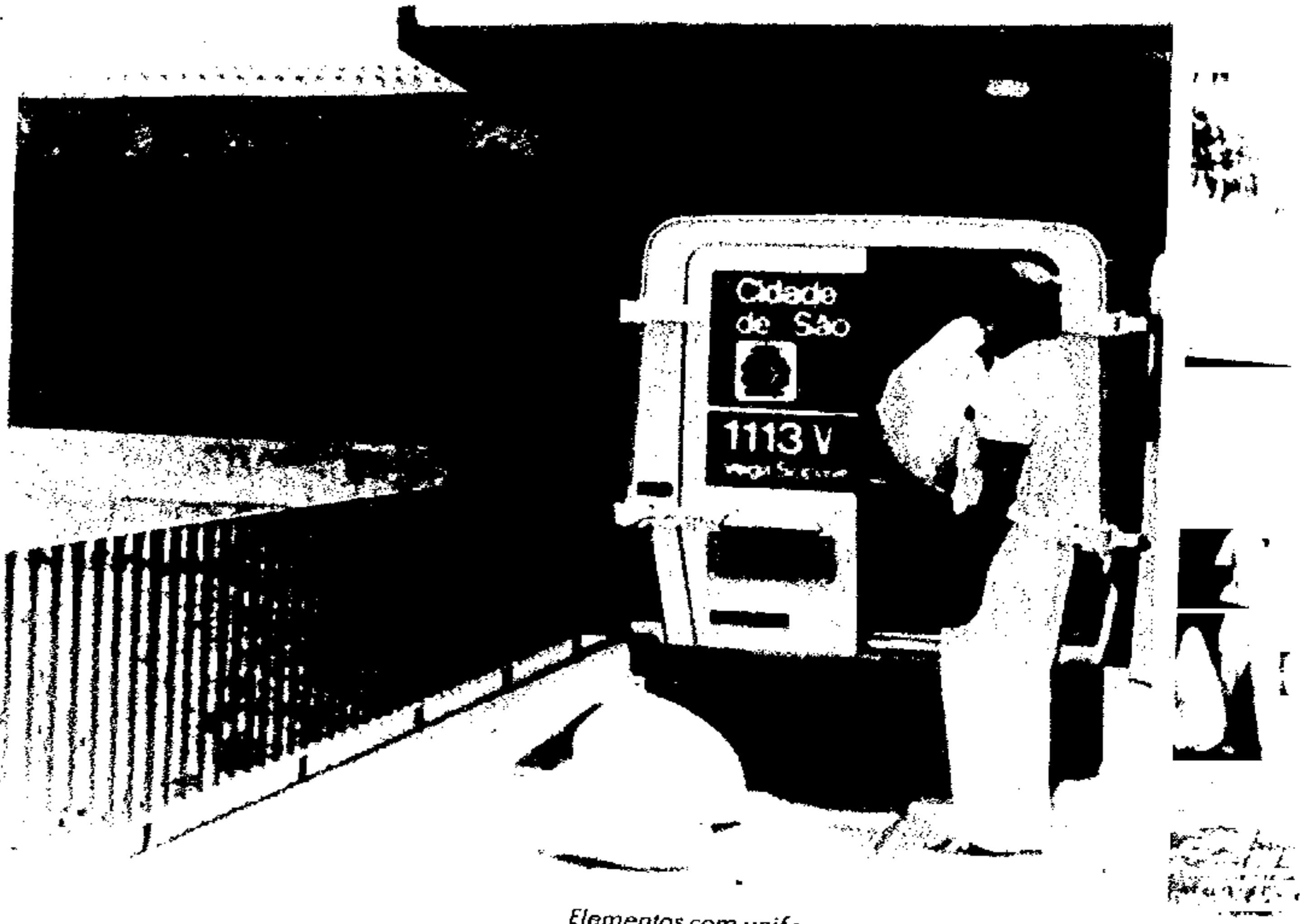
Elementos com uniformes especiais e luvas fazem a coleta.

Quando as equipes coletoras chegam aos hospitais e demais lugares onde existe lixo que exige medidas de segurança, todo o material recolhido já foi preparado e embalado em sacos plásticos especiais, dotados de índices mais elevados de resistência. Antes de serem colocados nos mesmos, todos os objetos contun-