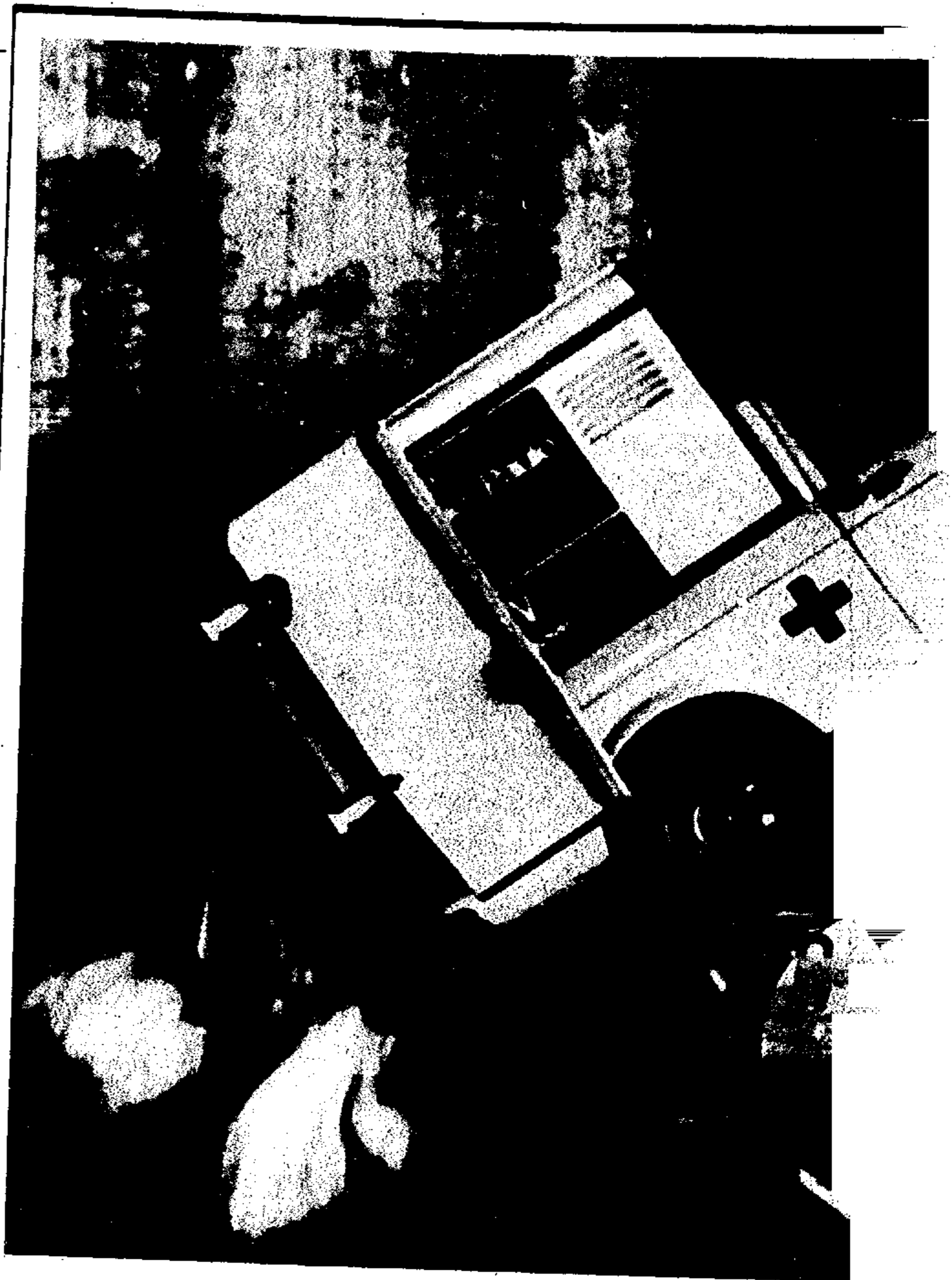
No incinerador, os veículos são tratados.

"Nenhum servidor poderá ter participação remunerada em mais de uma Comissão Permanente de Licitação na mesma Secretaria."