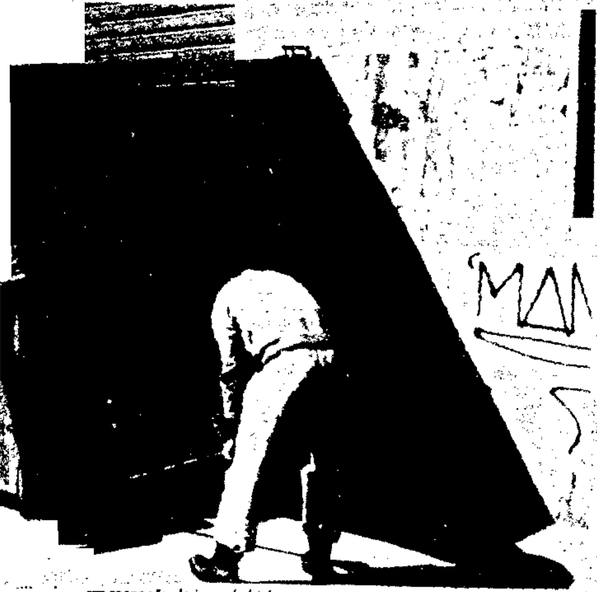
na recepção de jogo do bicho