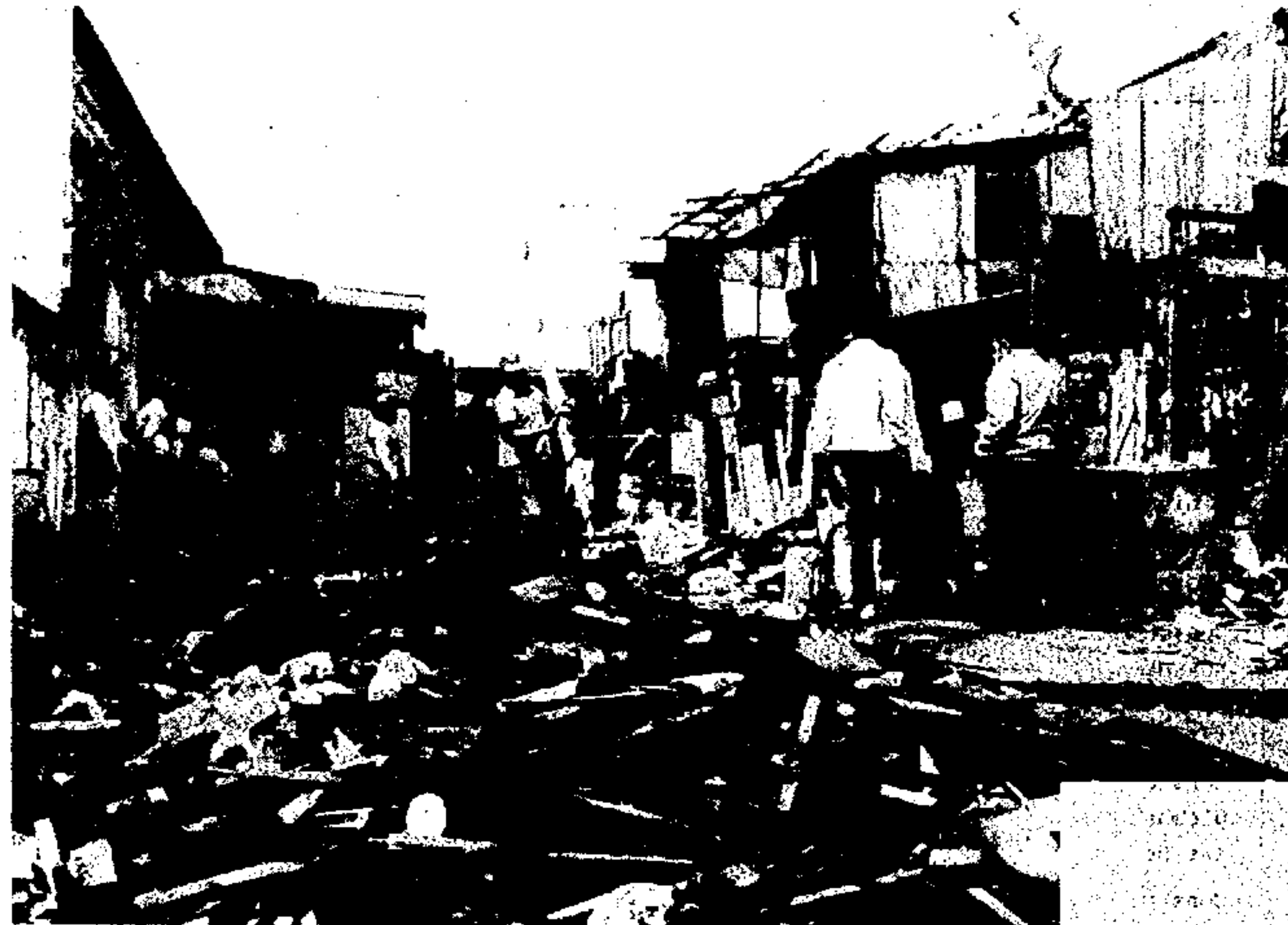
Pouco a pouco, as áreas livres vão surgindo, indicando o fim da favela Juscelino Kubitschek e sua substituição por um importante complexo viário

Um novo grupo de moradores da Favela Juscelino Kubitschek está sendo transferido para casas em conjuntos habitacionais da COHAB, pela Secretaria dos Negócios Extraordinários, conforme decisão judicial que determinou a liberação daquela área, a qual será utilizada pela Prefeitura para a implantação de importante complexo viário, decisivo para melhorar o trânsito na região.