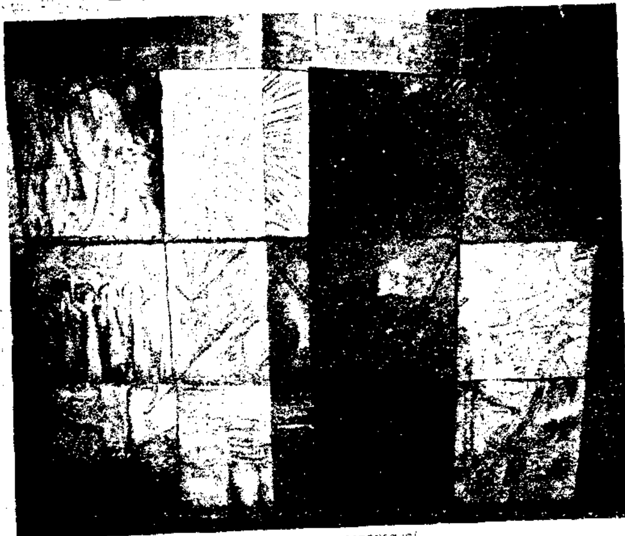
Cada aluno será responsável pela concepção de uma das peças que constituirão o monumento.

Um monumento vai ser dado à Cidade de São Paulo pelos 68 alunos da cadeira de Plástica I, da Faculdade de Arquitetura e Urbanismo, da Universidade Mackenzie. Trata-se de obra tridimensional coletiva que os estudantes farão e oferecerão ao Município, sem qualquer ônus para a coletividade. A obra será instalada nos jardins que ocuparam o lugar onde se encontrava a favela de Cidade Jardim. Última página