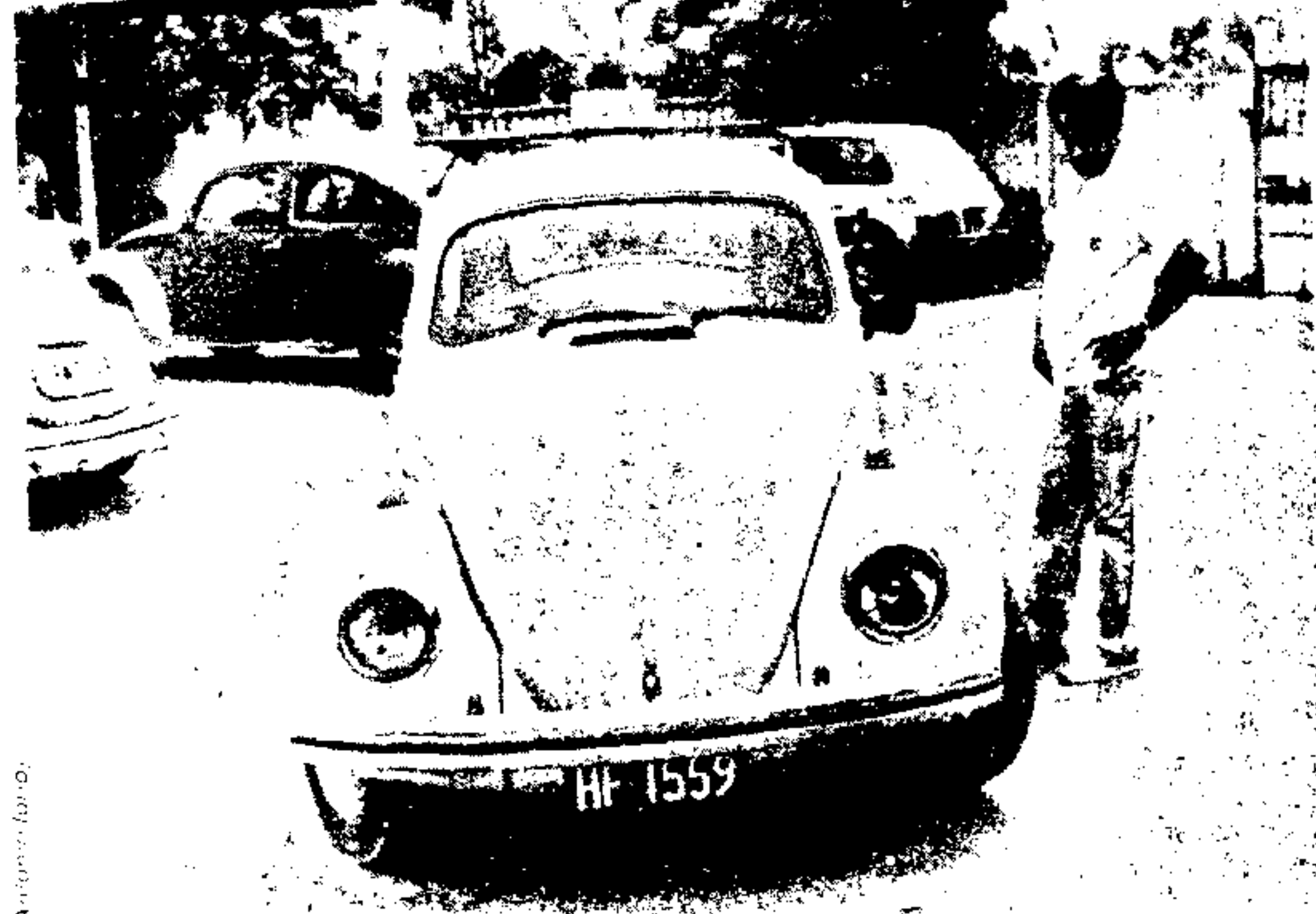
Nas fotos, o carro particular utilizado como táxi e a turbina que aumentava em até 50% o preço da corrida marcado no taxímetro.

Um monumento vai ser dado à Cidade de São Paulo pelos 68 alunos da cadeira de Plástica I, da Faculdade de Arquitetura e Urbanismo, da Universidade Mackenzie. Trata-se de obra tridimensional coletiva que os estudantes farão e oferecerão ao Município, sem qualquer ônus para a coletividade. A obra será instalada nos jardins que ocuparam o lugar onde se encontrava a favela de Cidade Jardim. Última página