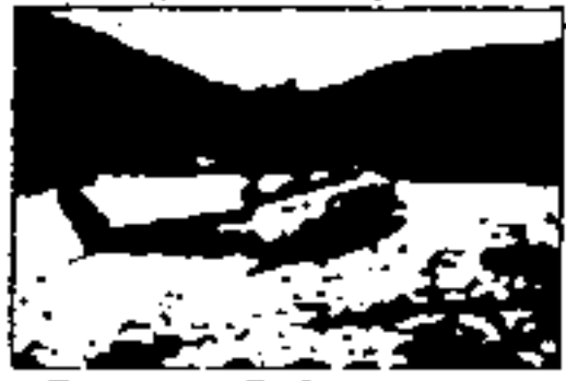
Busca e Salvamento