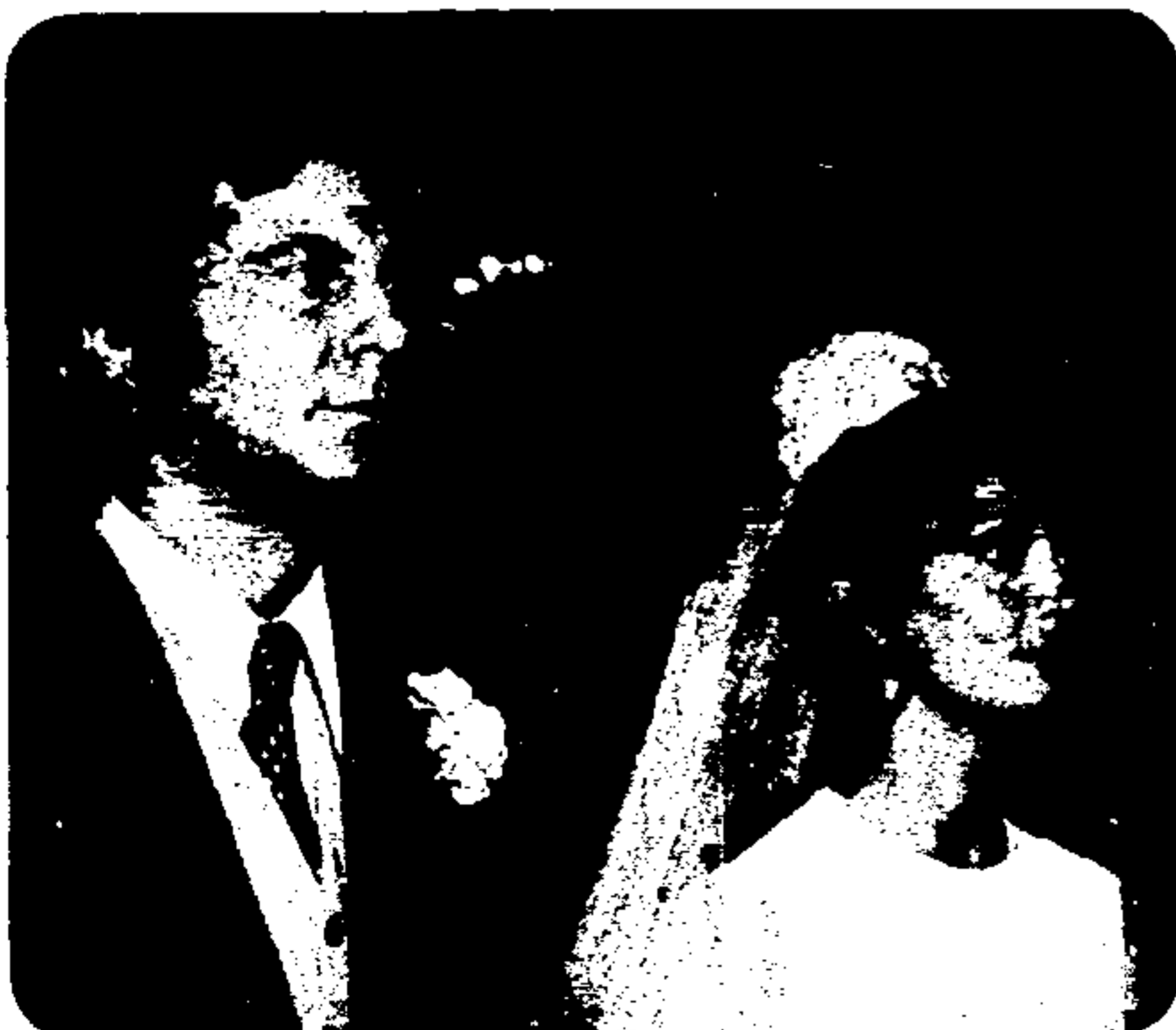
Num jogo de perfídia e amor, Carlos Zara e Eva Wilma em Mulheres de Areia . Rodada em Itanhaém.

Hoje, dedicando-se a outras atividades, Bráulio Pedroso diz que abandonou as telenovelas porque o público queria dois partidos, um bom e um mau, para poder torcer — como no futebol — o que ele se recusou a fazer. Nas suas novelas não havia heróis — mas anti-heróis — e os bons podiam ser ocasionalmente maus, ou vice-versa.