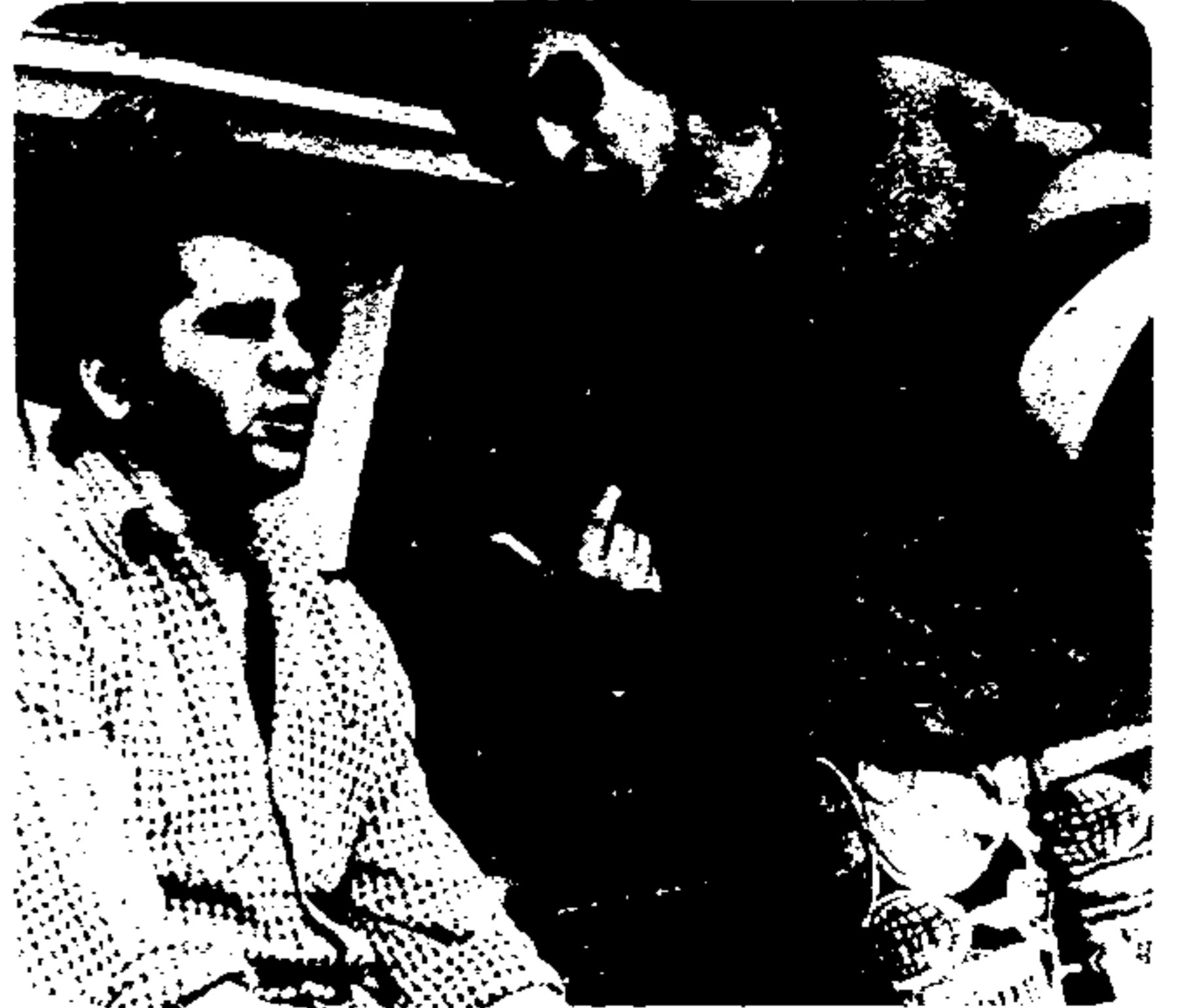
Em Beto Rockefeller , tentativa de linguagem nova e estudo de temas sociais. O esforço parou.