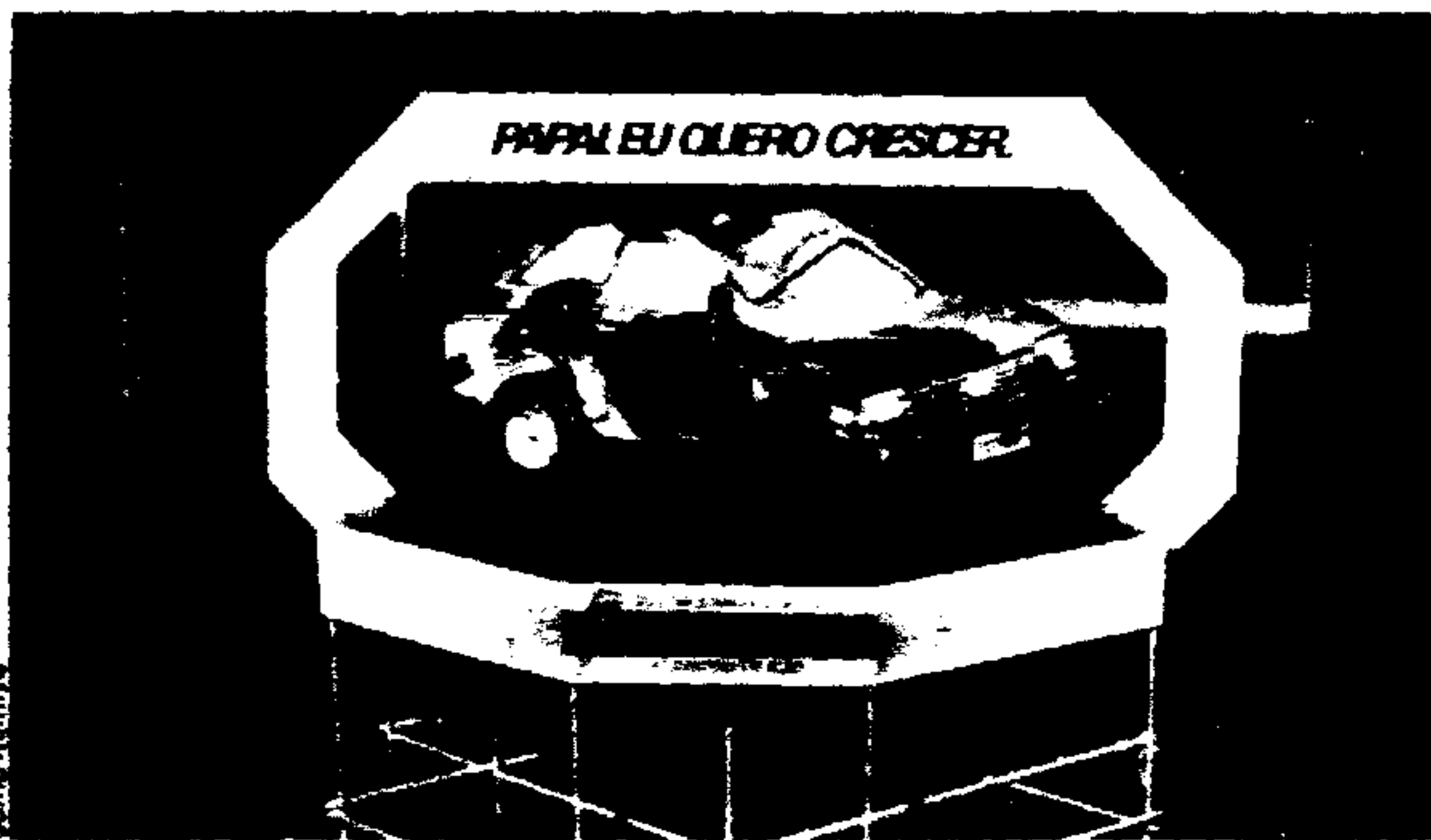
Plataformas como a da maquete estarão espalhadas por toda a cidade, alertando os paulistanos sobre os perigos do trânsito.