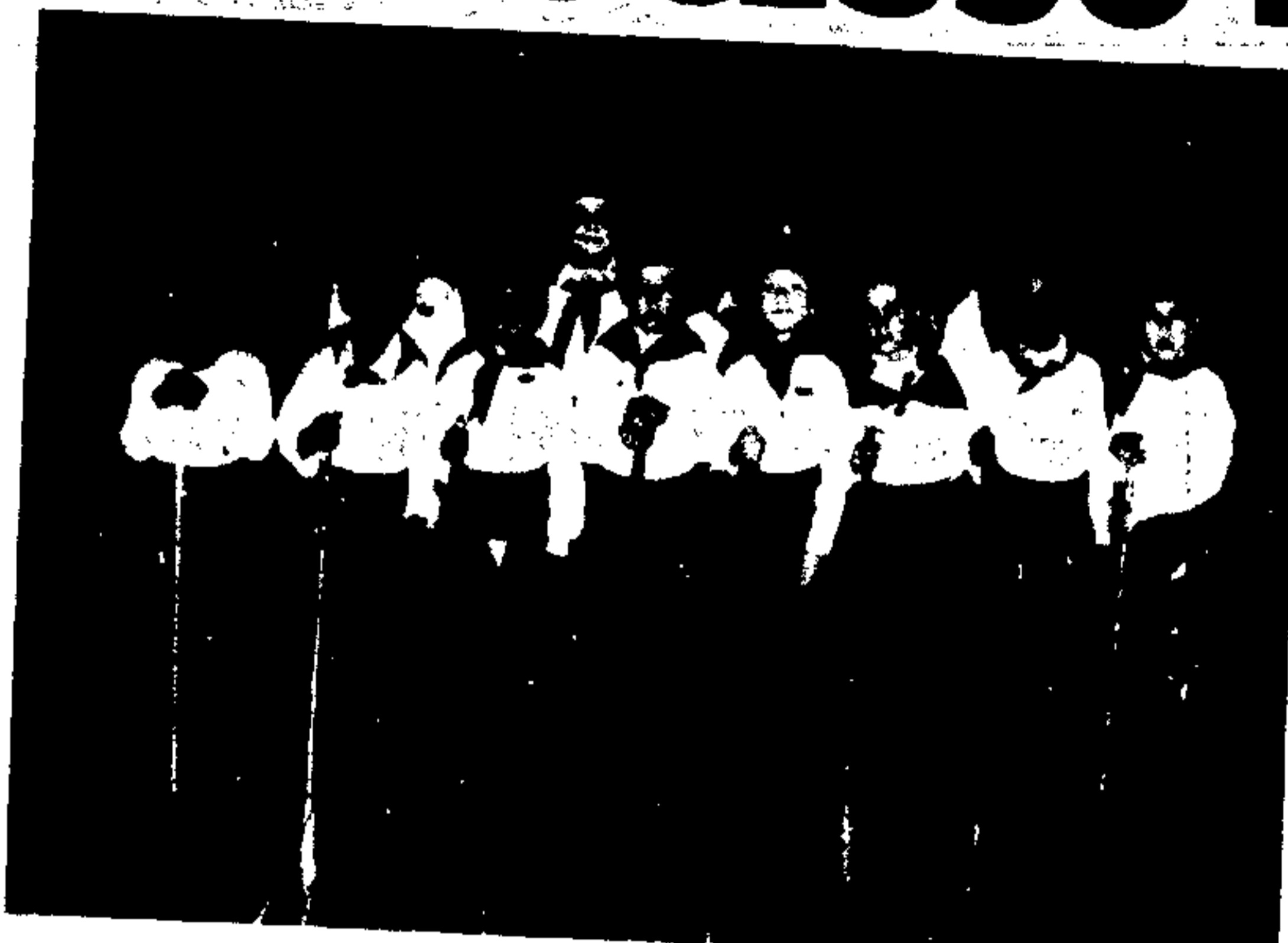
Os "gauchinhos" da EMEI Oswaldo Cruz

Uma das mais vivas preocupações da Secretaria Municipal de Educação, na atual Administração do Prefeito Jânio Quadros, foi a de criar uma infraestrutura operacional capaz de atender à demanda na área da educação infantil.