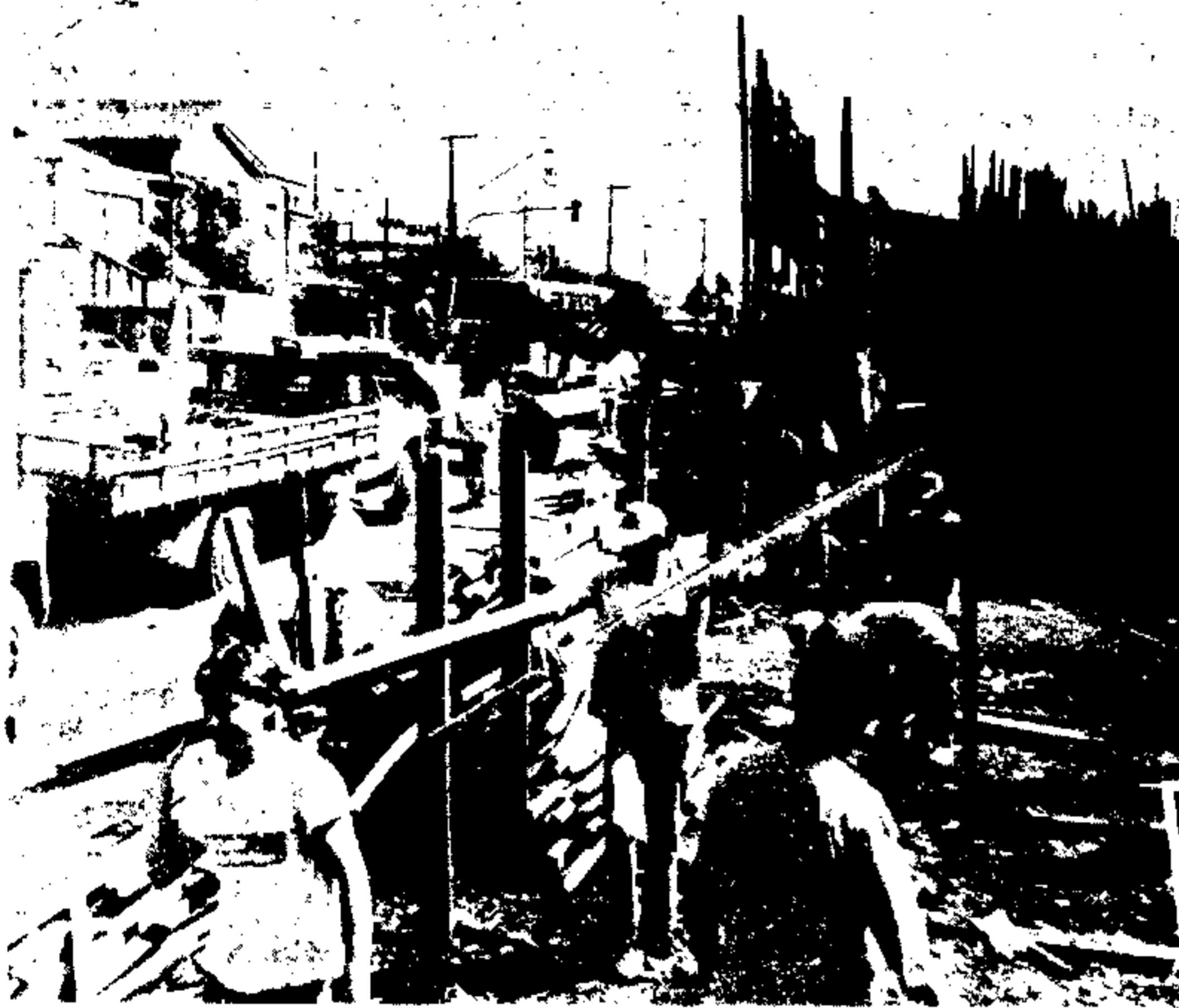
Servidoras municipais trabalharam o dia inteiro no desmonte e remoção dos barracões

Indivíduos audaciosos invadiram terrenos municipais no bairro do Jabaquara e chegaram ao cúmulo de construir estabelecimentos comerciais completamente irregulares, num atentado ao direito público e aos cofres da Cidade. Decidido a eliminar de vez esse problema, o Prefeito Jânio Quadros expediu ordens rigorosas ao SIGP — Serviço de Informações do Gabinete do Prefeito, para agir com todos os meios a seu dispor.