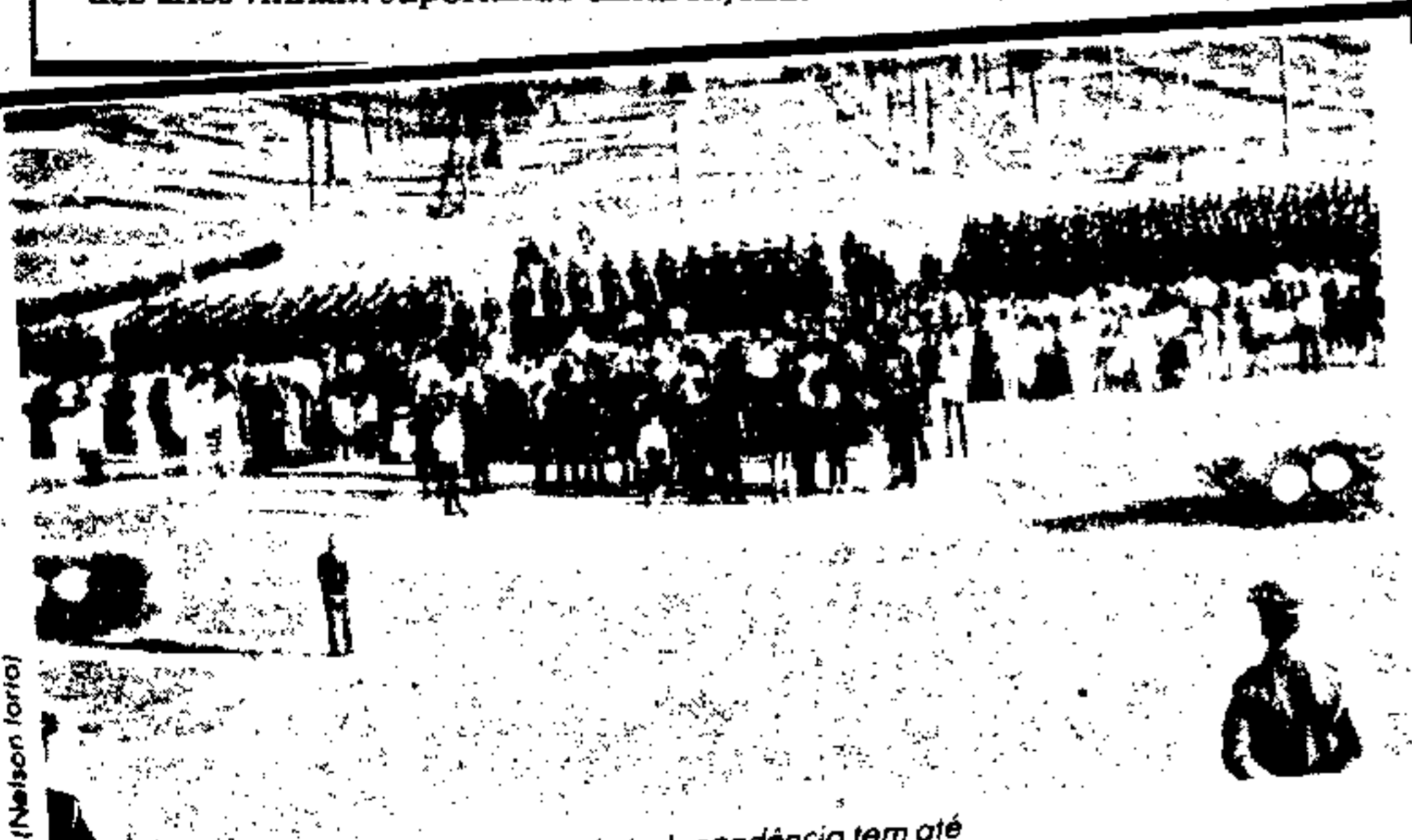
O Parque da Independência tem até um destacamento especial para sua segurança

Os dois veículos, que agora se encontram no pátio da Secretaria de Transportes, serão guinchados para o estacionamento do DETRAN e transformados em veículos particulares (o taxímetro será retirado e as placas substituídas).