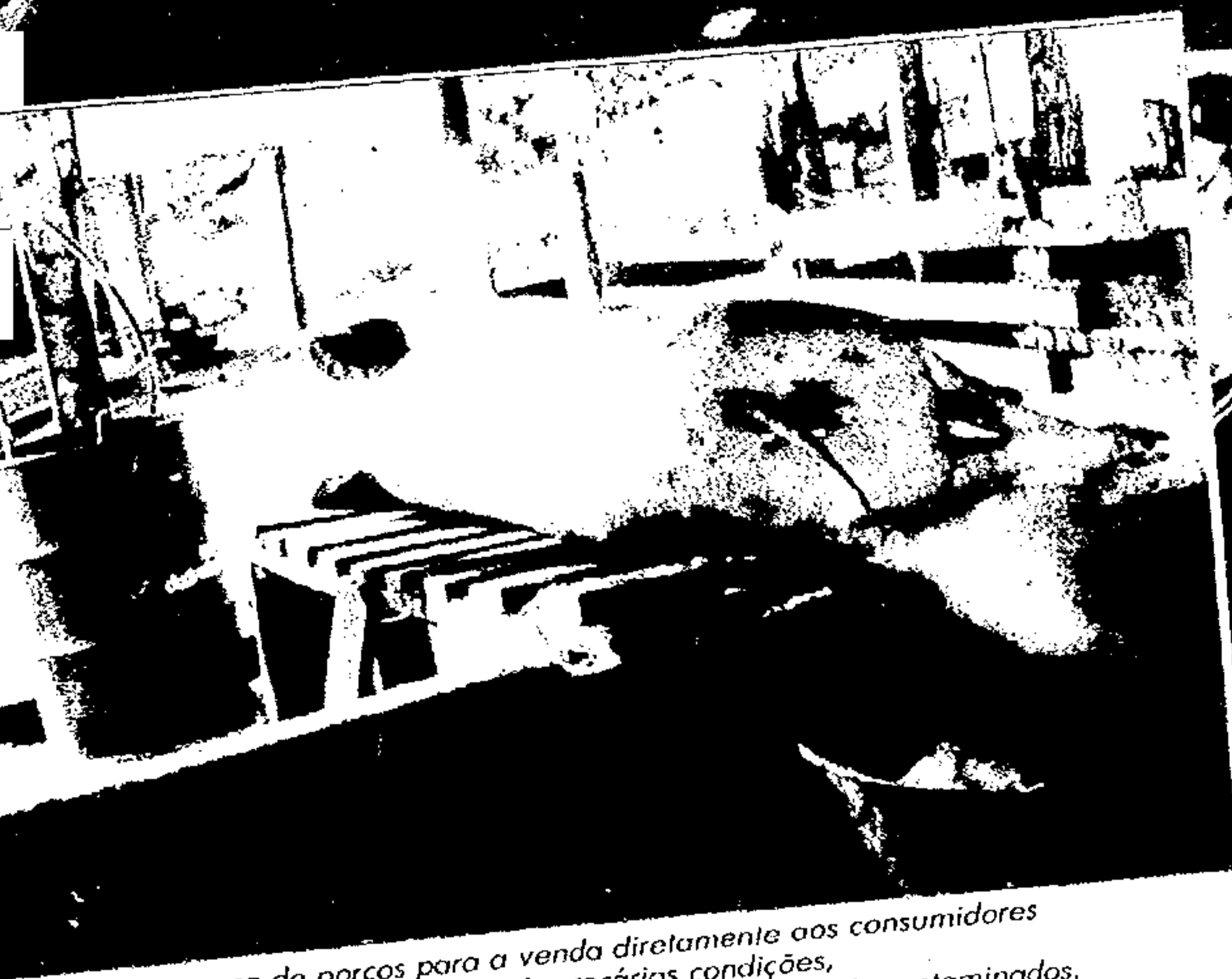
A matança de porcos para a venda diretamente aos consumidores é feita nas más precárias condições, sem exame do estado de saúde dos animais e em locais contaminados.