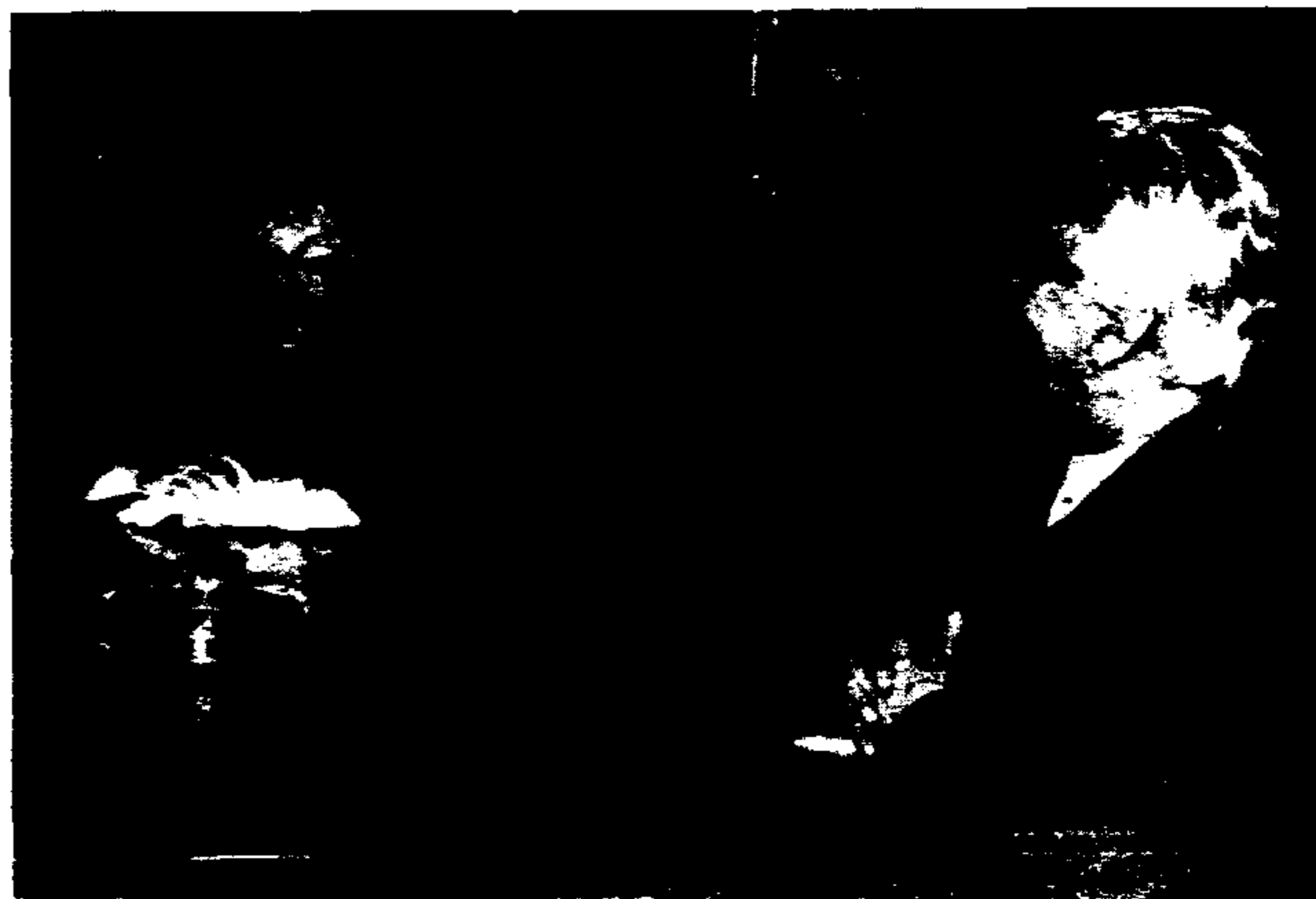
A Sra. Aniela Rubinstein, viúva do inesquecível músico, em animada palestra com o Prefeito Jânio Quadros. Página 2