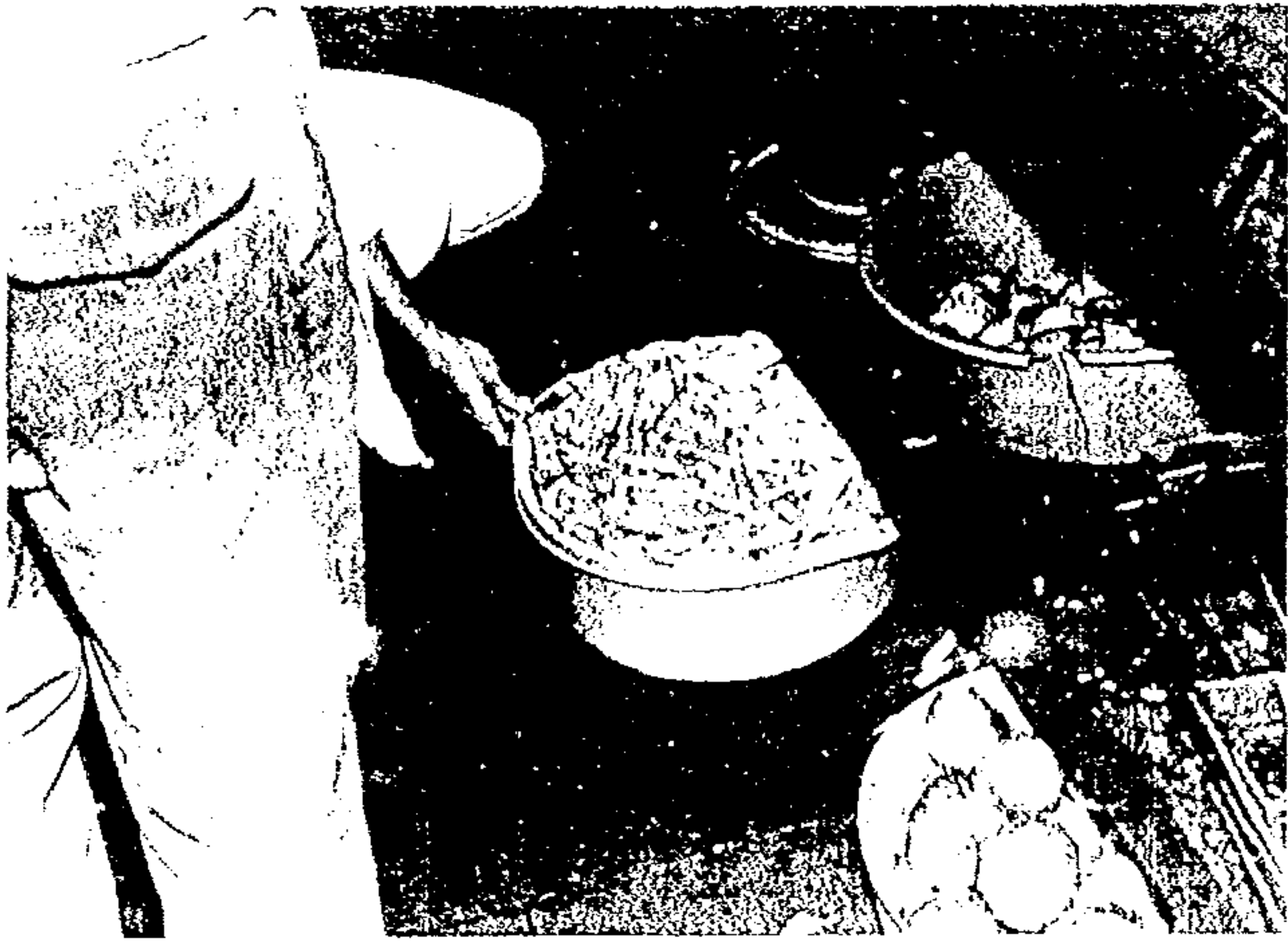
Alimentos conservados em péssimas condições de higiene, sob mesas sujas.