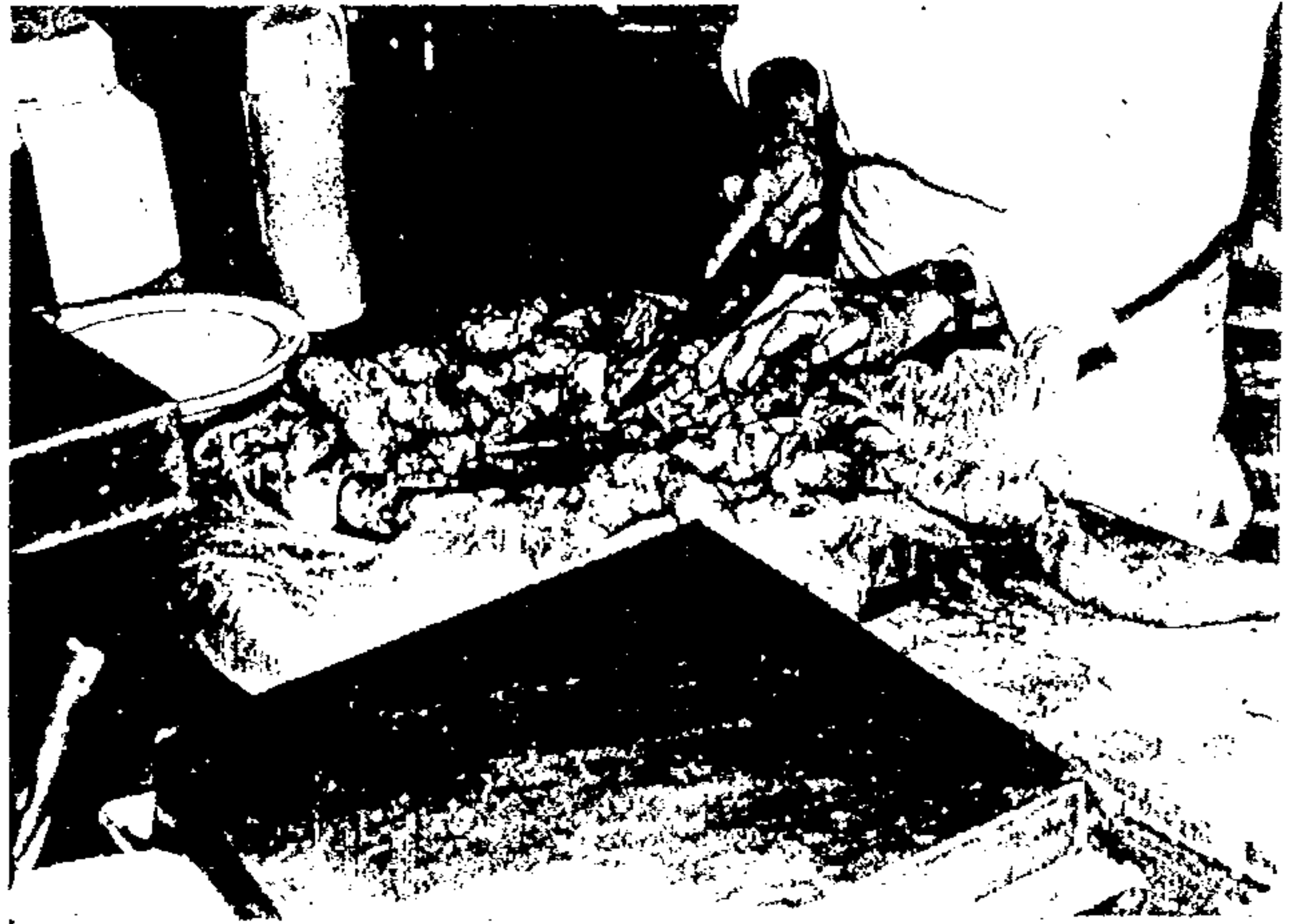
Lingüiça imprópria para o consumo, pegajosa e já com coloração esverdeada.

Em apenas uma semana, no período de 24 a 30 de outubro, a Secretaria do Abastecimento condenou mais de cinco mil quilos de mercadorias diversas, consideradas sem condições de consumo. O número consta de relatório em que o Secretá-