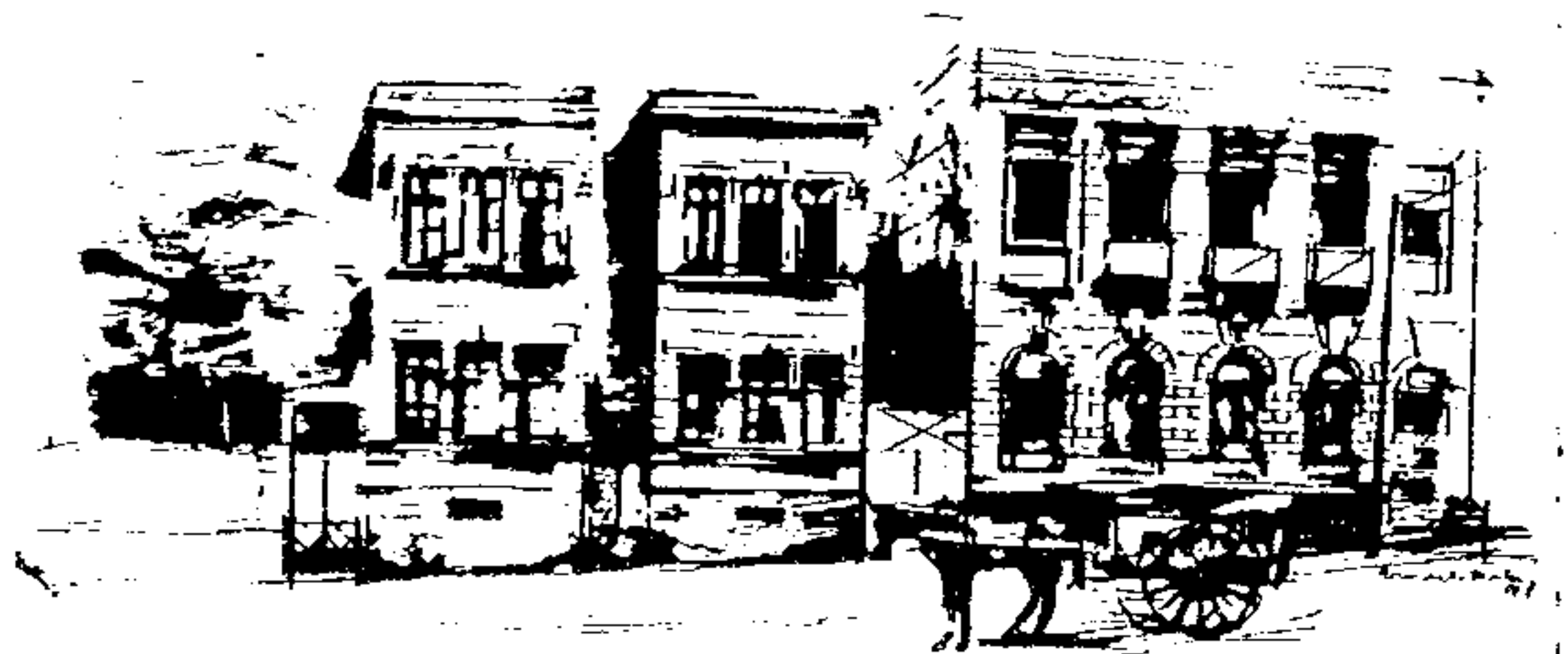
Reconstituição preparada pelo Departamento do Patrimônio Histórico e o prédio já recuperado para abrigar a sede do CEJUR.